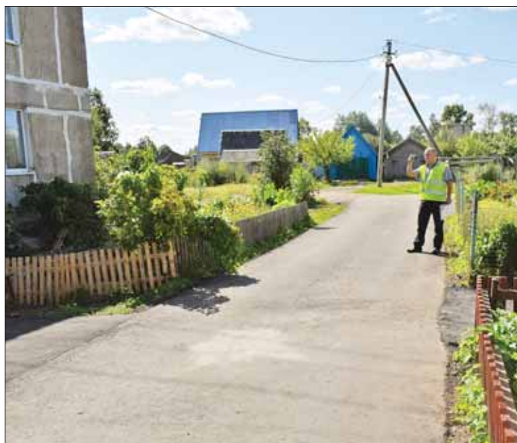
Оленинские дворы теперь не узнать.