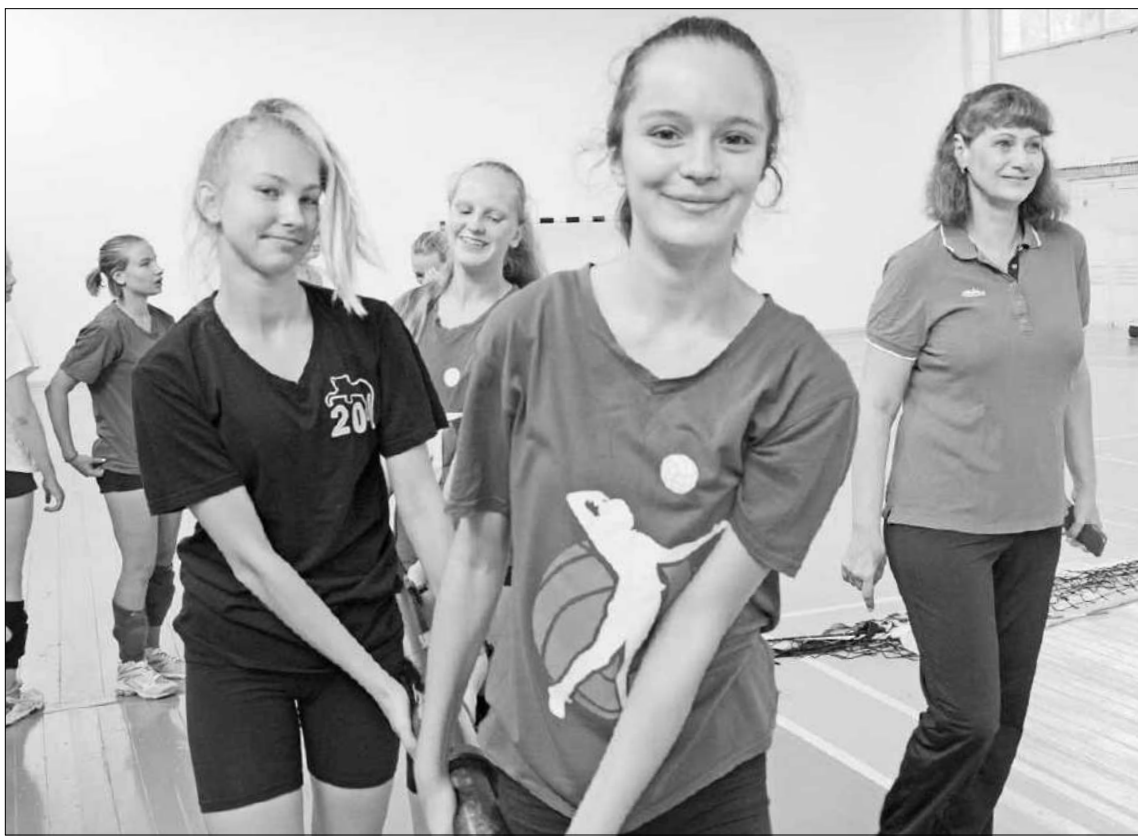
Теперь будущие чемпионы тренируются в хороших условиях.

И таких примеров, когда люди берут инициативу в свои руки и решают проблему сами, в регионе сегодня немало. Практически каждый день мы читаем в новостных лентах о том, как прихожане всем миром отреставрировали храм или часовню, как жители города или села вышли на субботник, как добровольцы реализовали новый социальный проект. Или