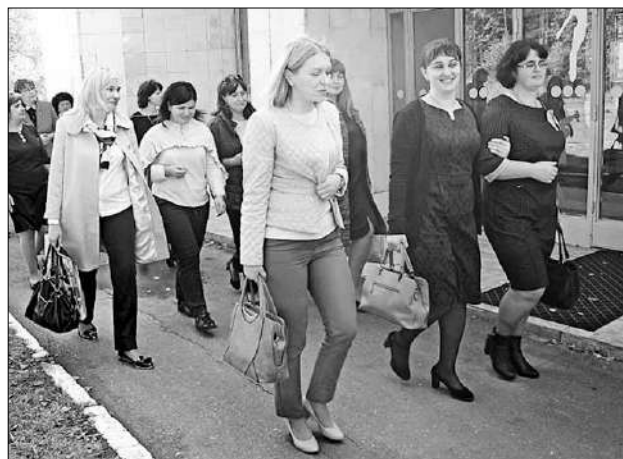
Руководители Тверского ЗАГС говорят: «Нам положено быть молодыми!».

Деловая часть встречи прошла в конференц-зале Карачарова. Перед ее началом Олег Лобановский знакомил гостей с возможностями района, со статистикой, имеющей отношение к демографии. Конаковский район – второй по площади в области, население – более 81 тыс. человек. Так что у сотрудников ЗАГС работы предостаточно: только за 8 месяцев этого года отделом произведено 2084 регистрации.