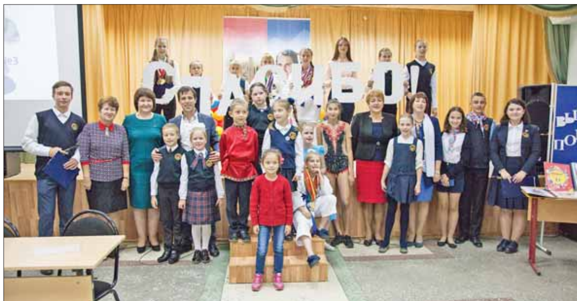
Стипендиаты конкурса «Умники и умницы-2018».

Проект «Умники и умницы Удомли», успешно стартовавший весной 2018 года, получит свое продолжение. Презентация второго сезона проекта состоялась 14 сентября в Удомельской гимназии №3.