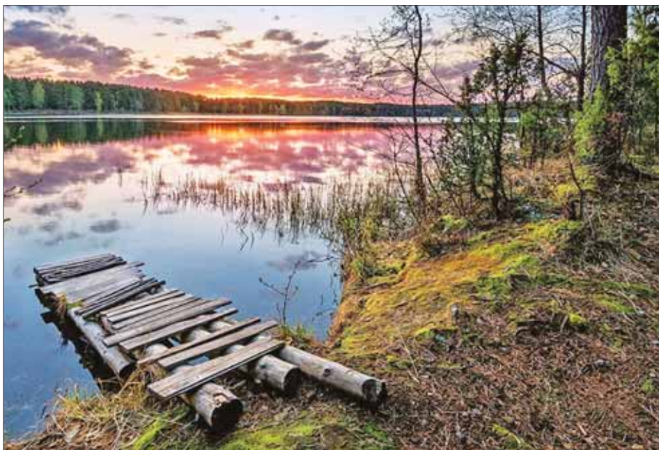
Этот снимок Селигера — один из самых умиротворяющих пейзажей в России.

Еще один муниципалитет с высокой готовностью — Оленинский район. Летом здесь привели