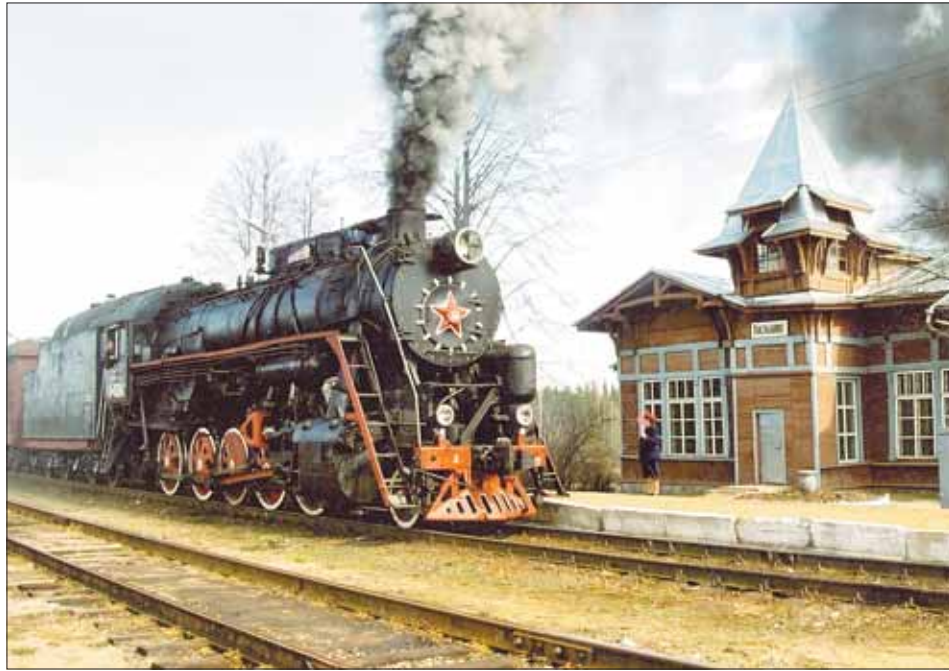
Баталино – еще одна интересная станция на новом маршруте.