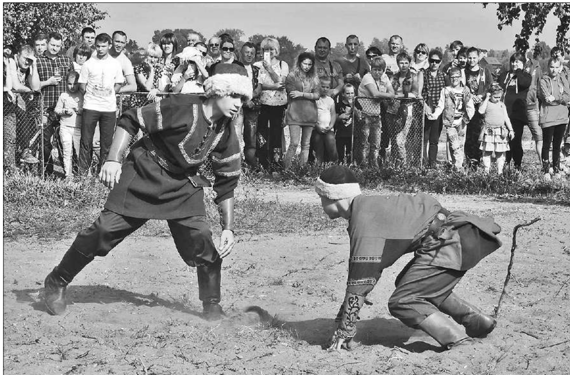
Сила и смелость всегда в цене.

Победу русского воинства в Калязине чтут, как особую веху в истории города. Начиная с 2009 года, когда в честь 400-летия победы над Смутой установили памятник полководцу Скопину-Шуйскому, в Калязине ежегодно проходят памятные мероприятия и патриотический песенный фестиваль «Калязин. Родина. Единство».