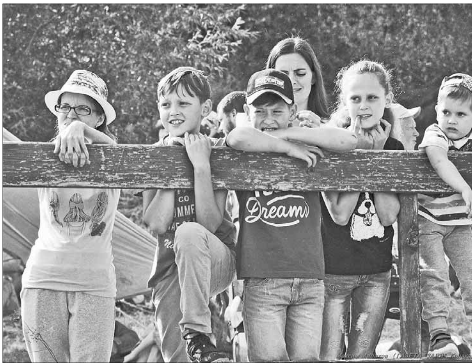
Зрители фестиваля «Русская земля» болеют за наших.