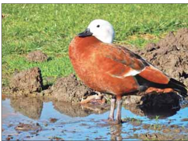
Новозеландский огарь (самка).

– Но вас-то в Новую Зеландию привел инте-