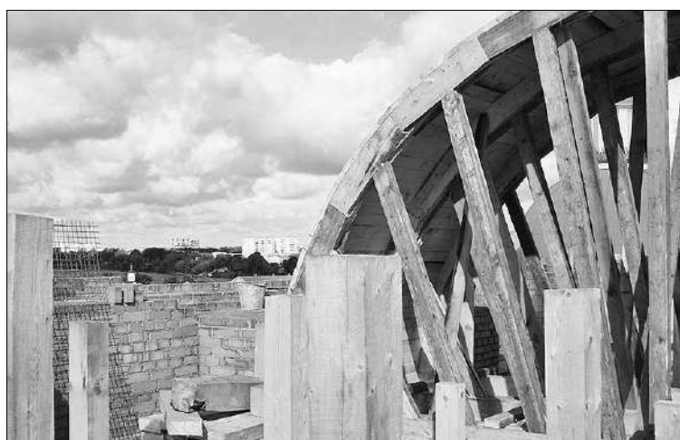
Уникальные детали храма воспроизводятся в точности.