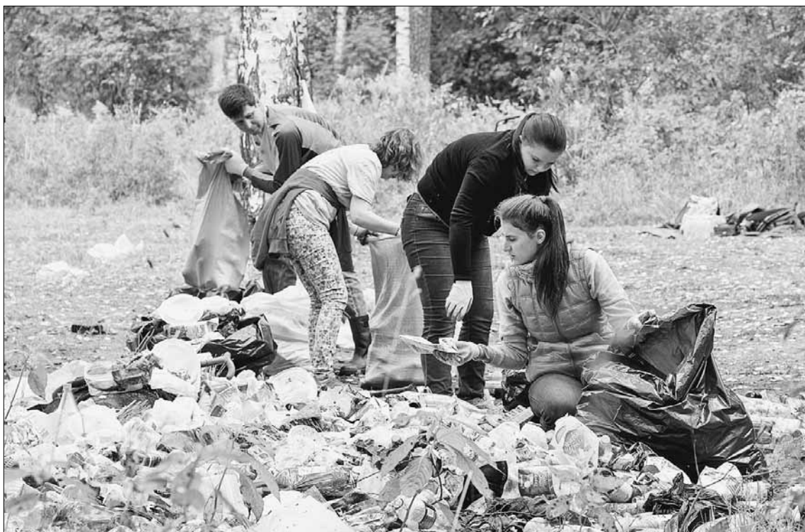
На генеральную уборку выходит молодежь.

Однако внимательные горожане заметили: контейнеры-то полупустые. Это не та ситуация, когда их не вывезли вовремя, вот и сыплется через край всякая гадость. Кто-то просто уронил пакет в двух шагах от мусорницы и поленился поднять. А дурной пример заразителен: такая кучка всегда служит магнитом для прохожих, которым срочно нужно что-то выкинуть, и к вечеру вырастает как на дрожжах. Так что большинство участников форума сошлись во мнении: не бросайте мусор мимо урн, и не будет поводов для «праведного гнева».