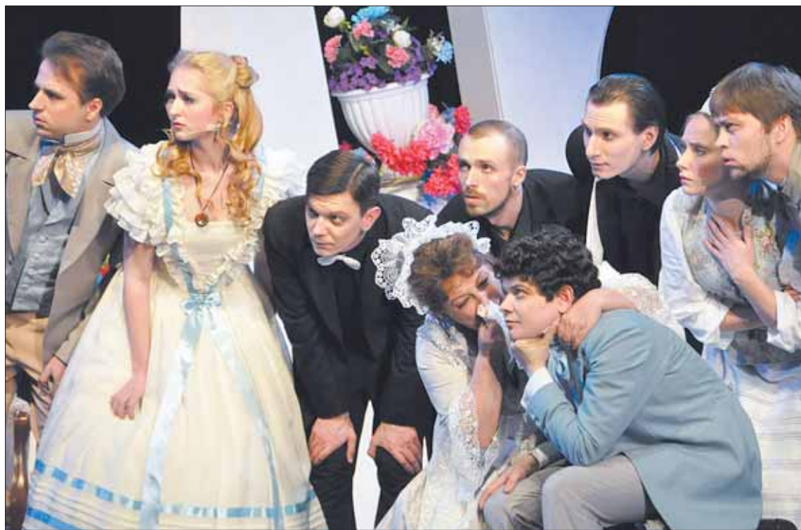
Гастроли начались с постановки по роману Ивана Гончарова «Обыкновенная история».