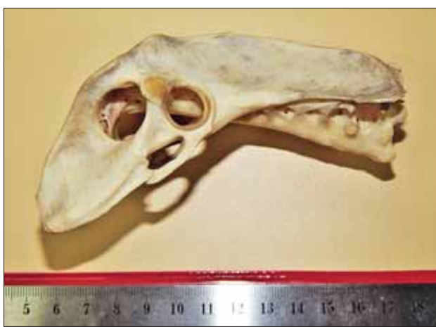
Тазовая кость орла Хааста (вид сбоку).

рес к вымершему виду. И тех, кто не выдержал соседства с человеком и привнесенными им представителями фауны, гораздо больше уцелевших.