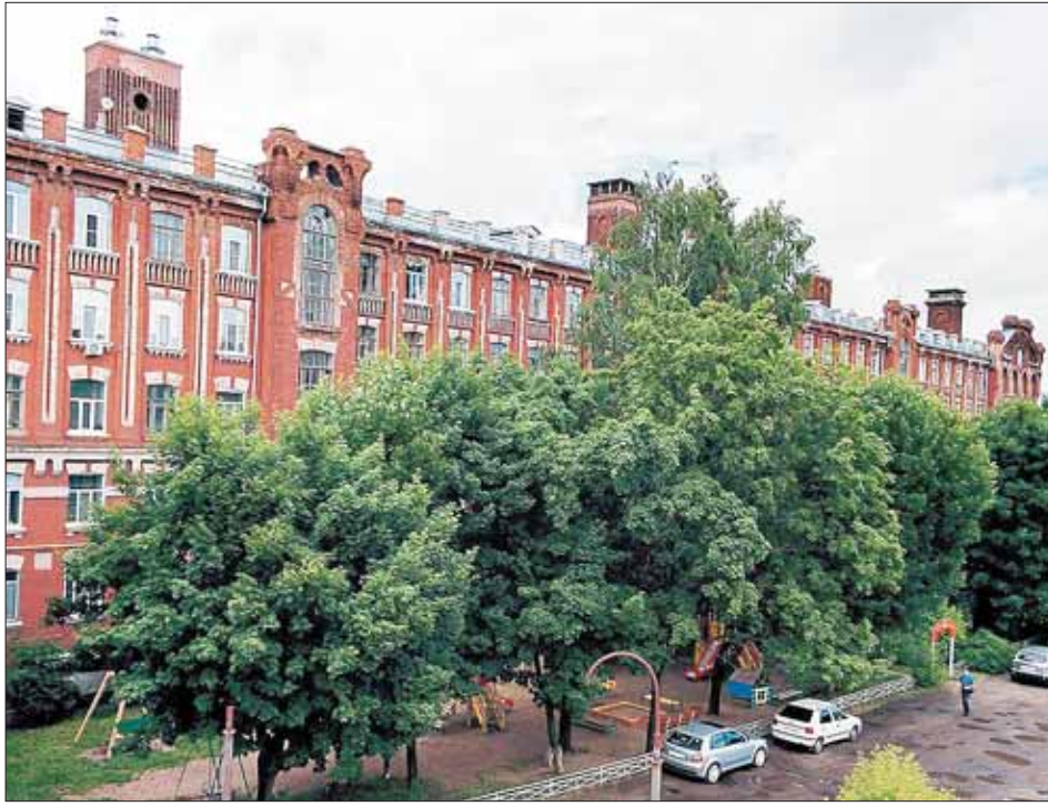
«Париж» просит помощи.

Его собственные книги были удостоены многих наград: «Маша Регина» — лонг-лист премии «Рус-