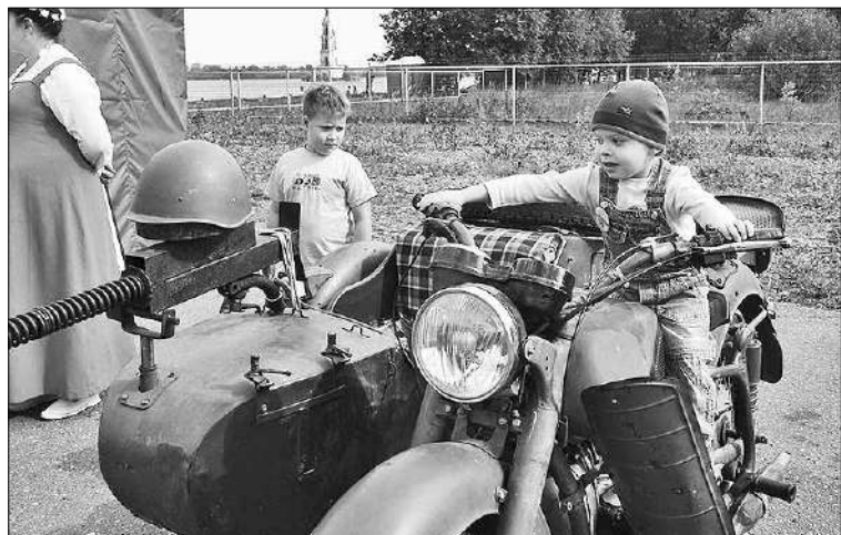
На таком ездил прадед.

Администрация Калязинского района и туристическая «Компания Пилигрим», как главные организаторы фестиваля «Походная кухня», благодарят всех, кто помог состояться этому масштабному событию. Праздник получился по-настоящему народным и не только развлекательным, но и просветительским, патриотическим мероприятием.