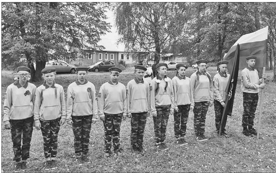
Юнармейцы на уроке истории.

Открытие возрожденного памятника состоялось 12 сентября. Оно было приурочено к празднованию перенесения мощей святого благоверного князя Александра Невского. В центре Бер-