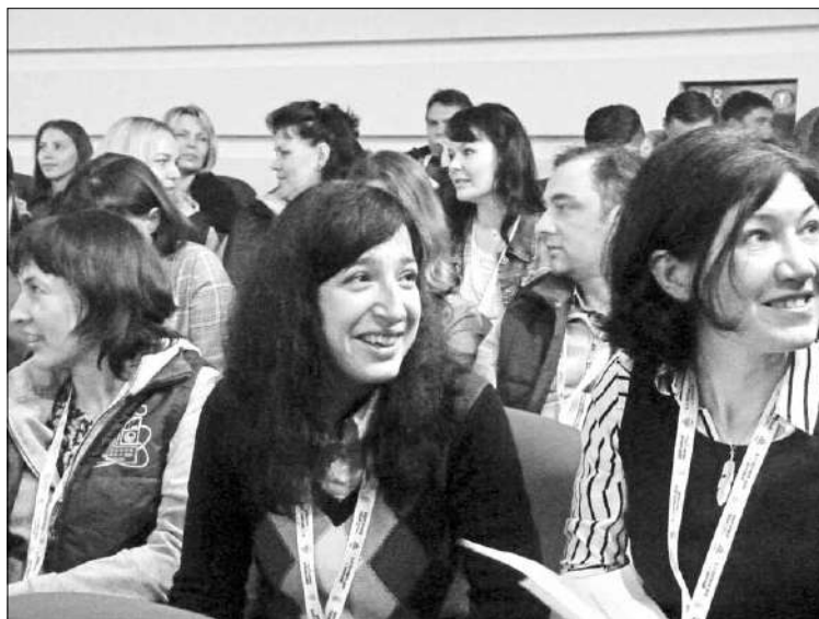
Дискуссия всех задела за живое.

Об этом говорила, например, специальный гость фестиваля Марианна Максимовская, обладательница престижных жур-