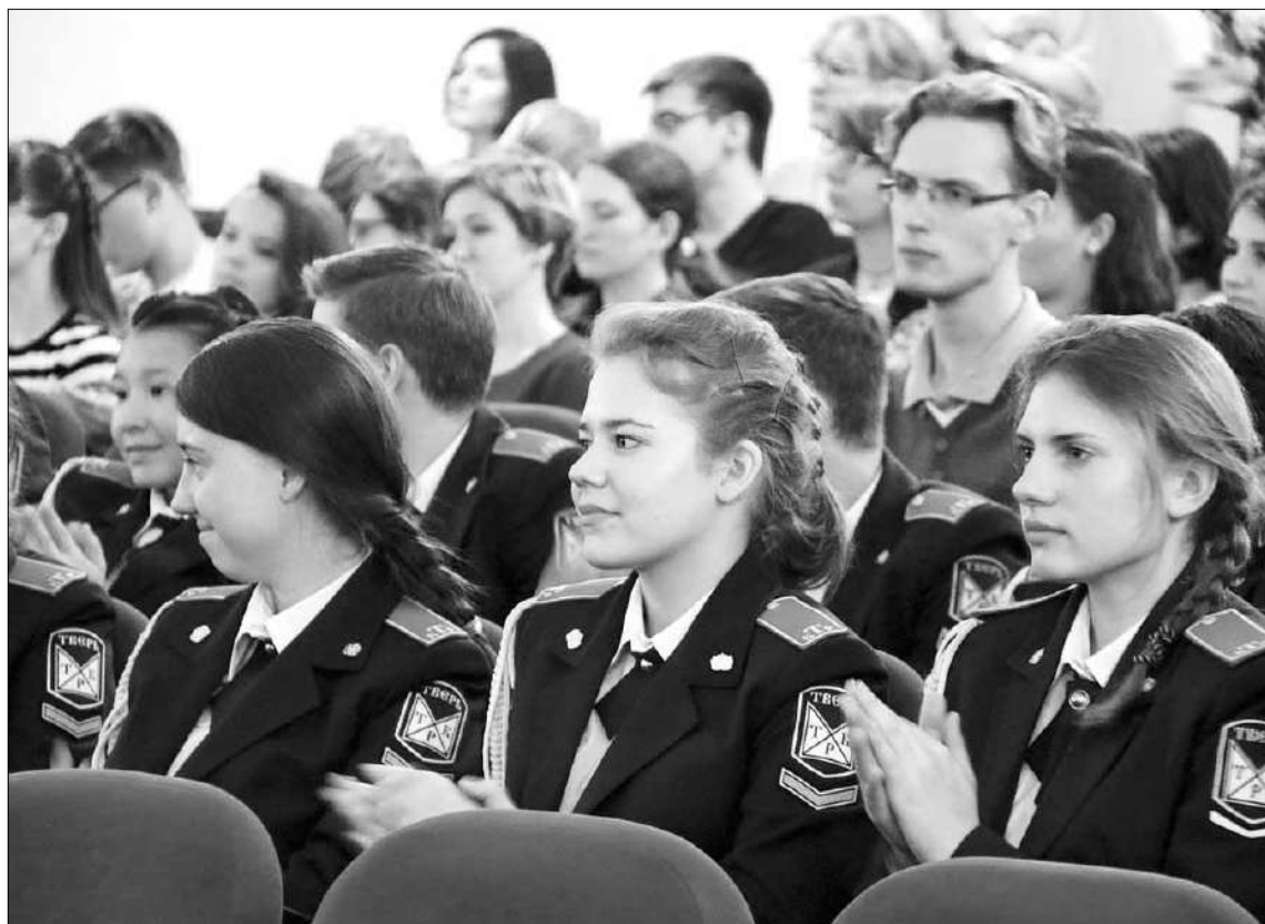
Ученики класса лесного и лесопаркового хозяйства уже определились с будущей профессией.