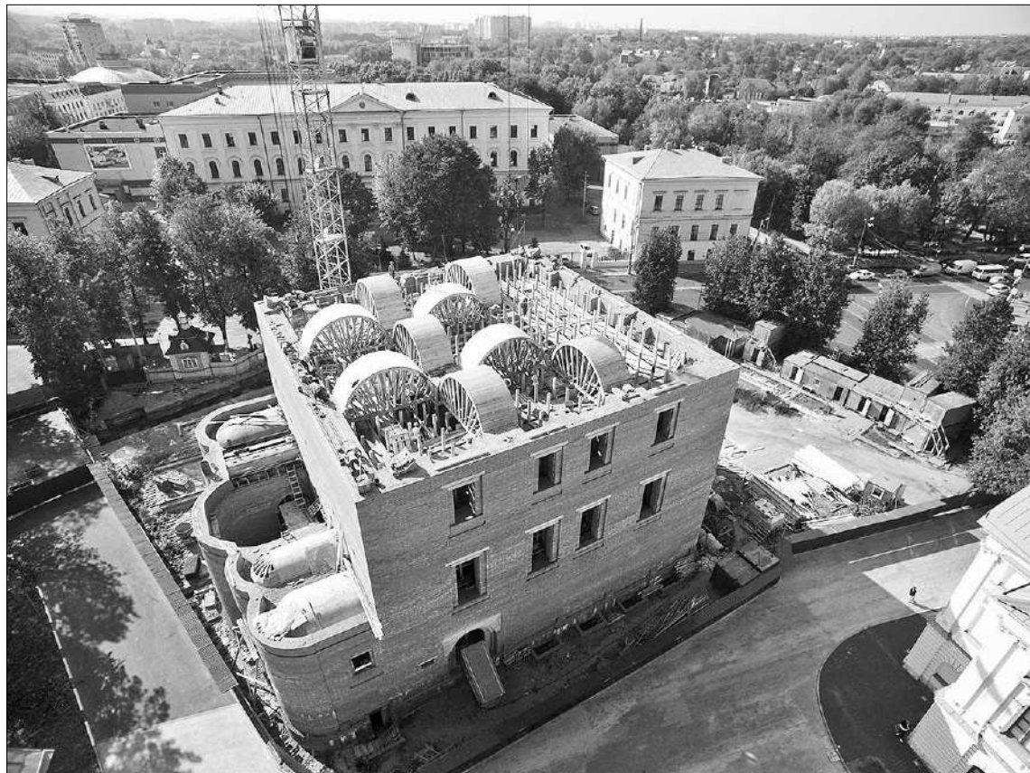
Возвращение Спаса стало осязаемым.

В том, что восстановленный Спас ни на один сантиметр не будет отличаться от того, что