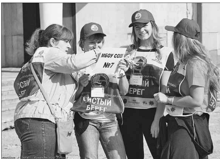
Экологическая акция в Конакове.

К примеру, сегодня в Дне чистоты участвуют Лесное, Удомля, Кимры, Рамешки, Калязин, Торжок, Торжокский район и другие муниципалитеты. И, конечно, областная столица. К вечеру четверга о своей готовности включиться в акцию заявили около 500 тверитян, а теперь их уже больше. Порадовал ЗАТО Озерный – оттуда тоже сообщили о привлечении 500 волонтеров. Власти Твери и всех присоединившихся муниципалитетов взяли на себя обязательства по вывозу мусора.