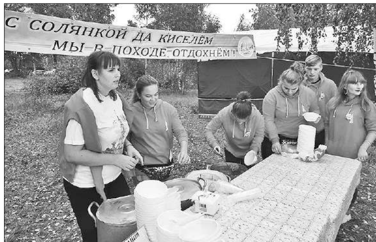
Девиз фестиваля вызывает аппетит.