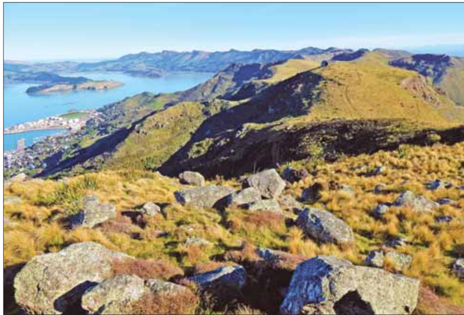
Вид на город Литтлтон и его окрестности.

ный. Он тоже пытается быть похожим на запад, но замечательно, что не теряет своего колорита, обычая. Возможно, в этом плане интересна Африка. Там я еще не был.