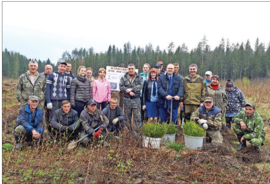
На Всероссийском дне посадки леса.

исправно получают достойную зарплату и полностью обеспечены социальными льготами и гарантиями. А в бюджет поступает больше налогов.