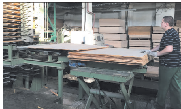
Загрузка пакетов шпона в пресс АО «Нелидовский ДОК».