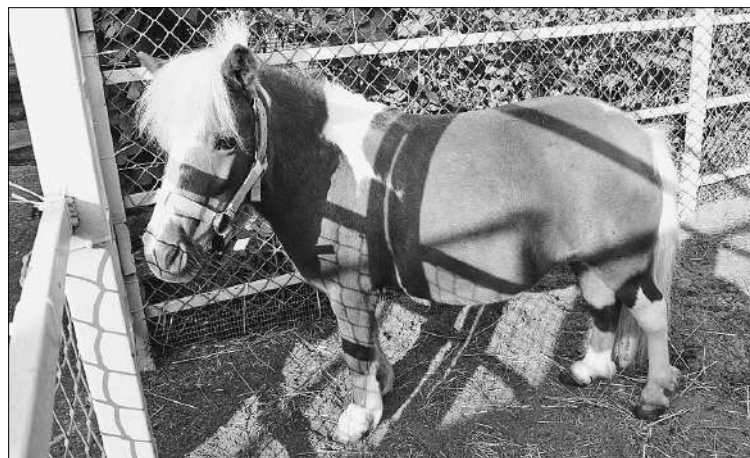
Такая вот Морковка.

Пони можно гладить сбоку по шее. Но предварительно обязательно попросив разрешение у человека, который ее держит.