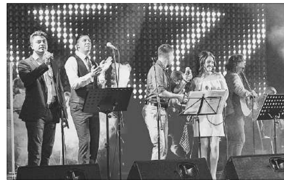
Проект собрал более 400 талантливых музыкантов и исполнителей.