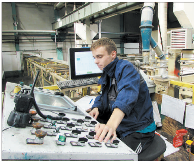
Работать на ультрасовременном оборудовании и видеть перспективу – это интересно.

одной из форм поощрения сотрудников. Такие призы получают победители спортивных соревнований (о них расскажем чуть позже) и внутризаводских профессиональных конкурсов, самый значимый из которых – «Лидер производства».