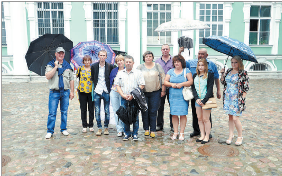
Стало доброй традицией отправлять лучших сотрудников с семьями на экскурсии.

Организация культурного досуга работников – момент для завода принципиальный. Поездки в музеи, театры, по достопримечательностям Верхневолжья, Москвы и Санкт-Петербурга стали