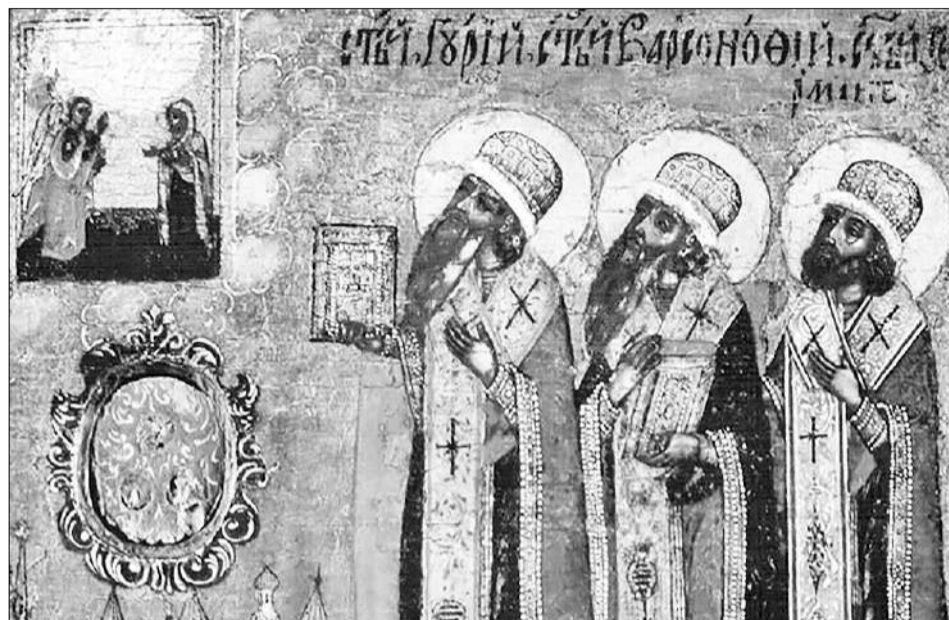
Гурий, Варсонофий и Герман.

По царской же воле в помощь ему был отправлен в Казань архимандрит Варсонофий, будущий епископ Тверской. То, что он им станет, еще в ту пору, когда Варсонофий был всего лишь иеродиакон, предсказано было его предшественником, святителем Акакием, младшим братом Иосифа Волоцкого. Целых 45 лет — с 1522 по 1567 годы — возглавлял Тверскую епархию святитель Акакий, которому дан был дар прозорливости. Но прежде того как исполнилось его предсказание, целых 12 лет преподобный Варсонофий создавал монастырь и строил храмы не только для духовного окормления русских переселенцев, но и для рас-