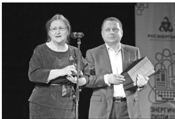
Престижный титул обязывает.

«Тверская Жизнь» стала лидером рейтинга публикаций о концерне «Росэнергоатом».