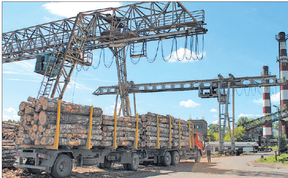
Разгрузка сортиментовоза краном.

дернизации производственного оборудования и применения новых технологий, совершенствования организации труда.