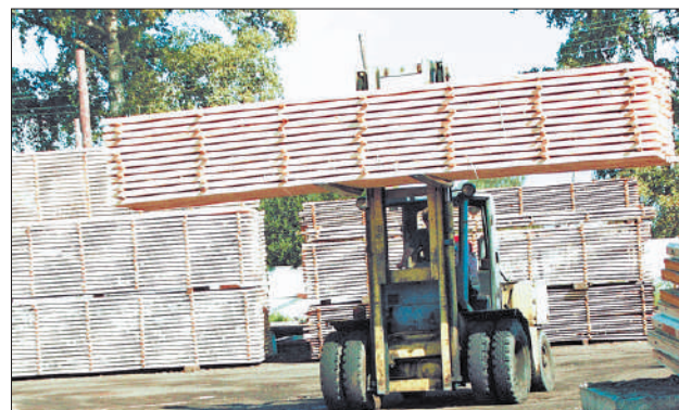
Пиломатериалы. ЗАО «Вышневолоцкий ЛПХ».