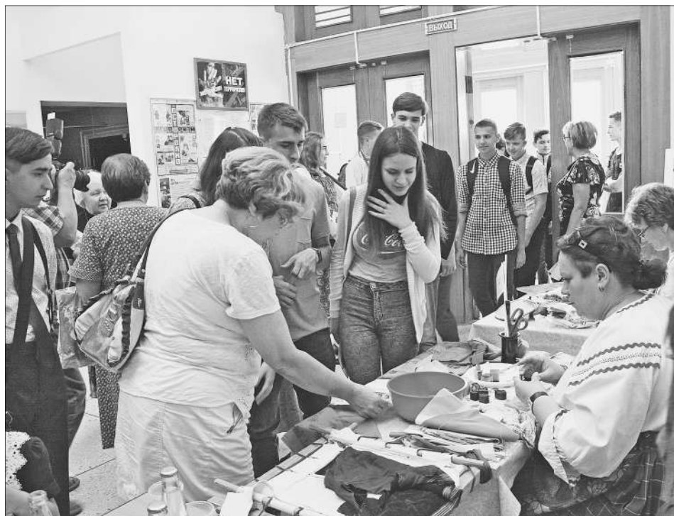
Вернисаж превратился в мастер-класс.