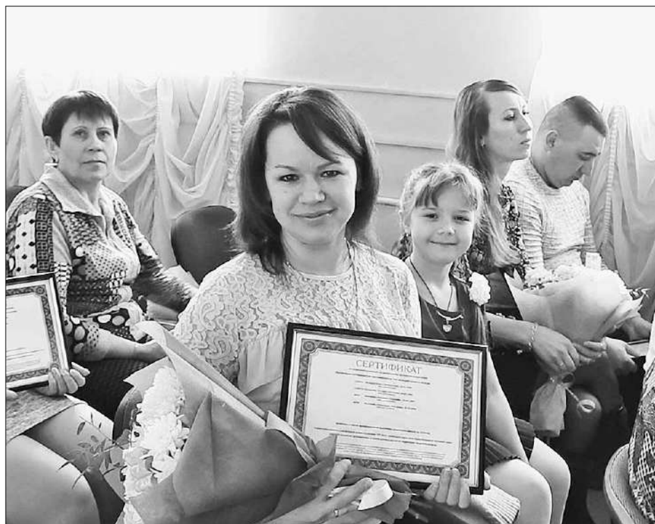
Вручение сертификатов в Калязинском районе.