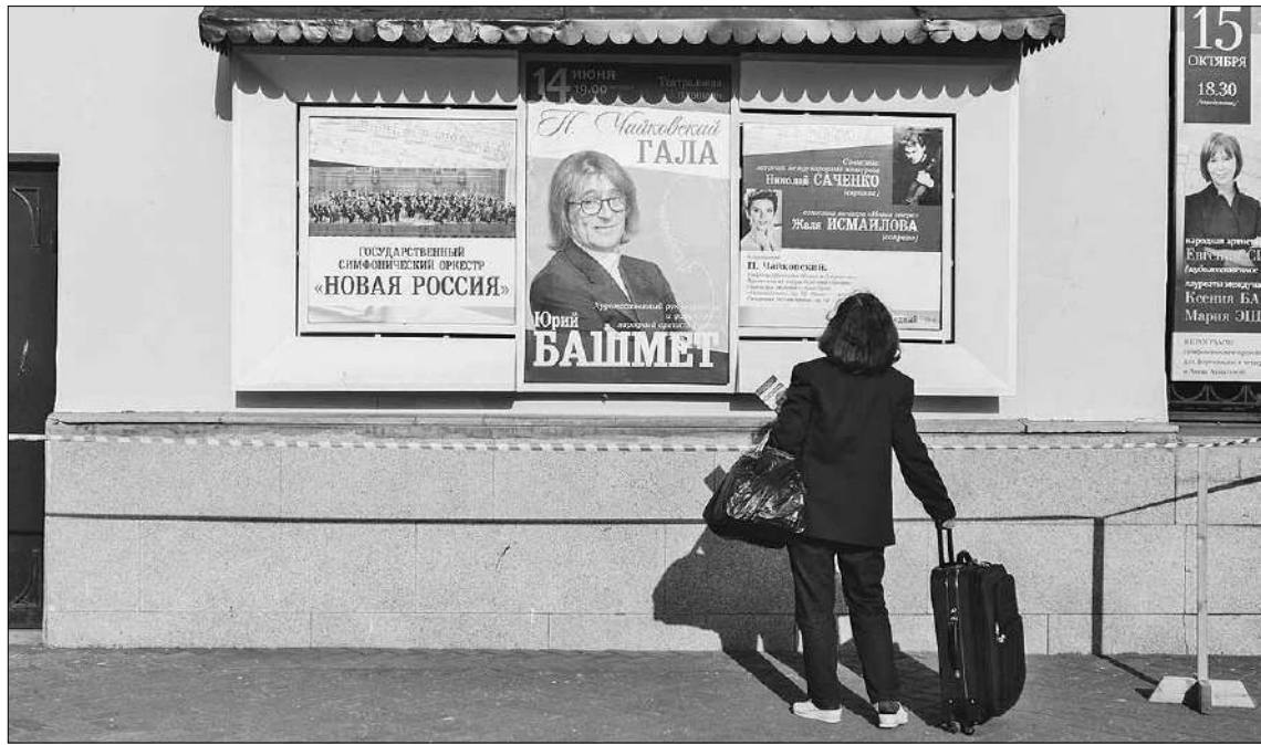
Позади почти 300 программ, впереди — еще больше.