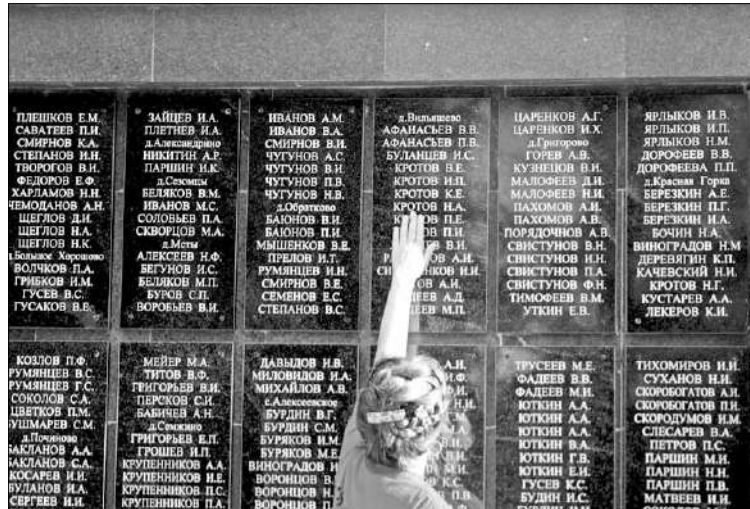
Стела с именами заклінцев, погибших на фронте.

А вот на памятной стеле с именами жителей Застолбского