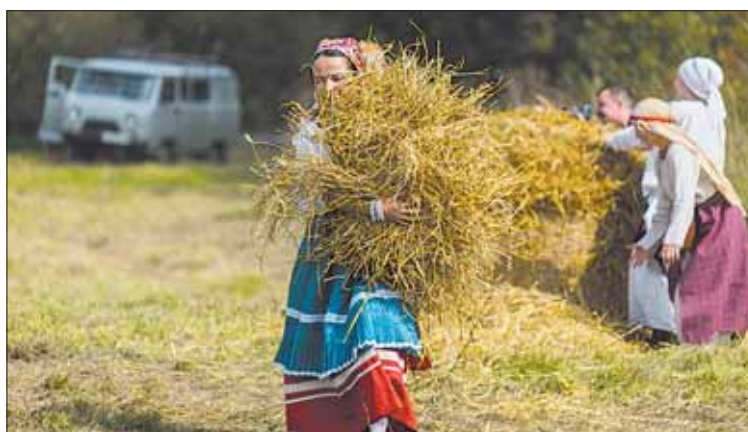
Почти как на картине Венецианова.