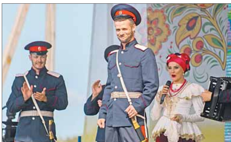
Выступает ансамбль «Русская воля».

– Люди говорят: «Не хотим, чтобы все это пылело на чердаках. Это же наша история, старинный русский быт». А на Дне русской деревни можно в прямом смысле слова прикоснуться ко времени.