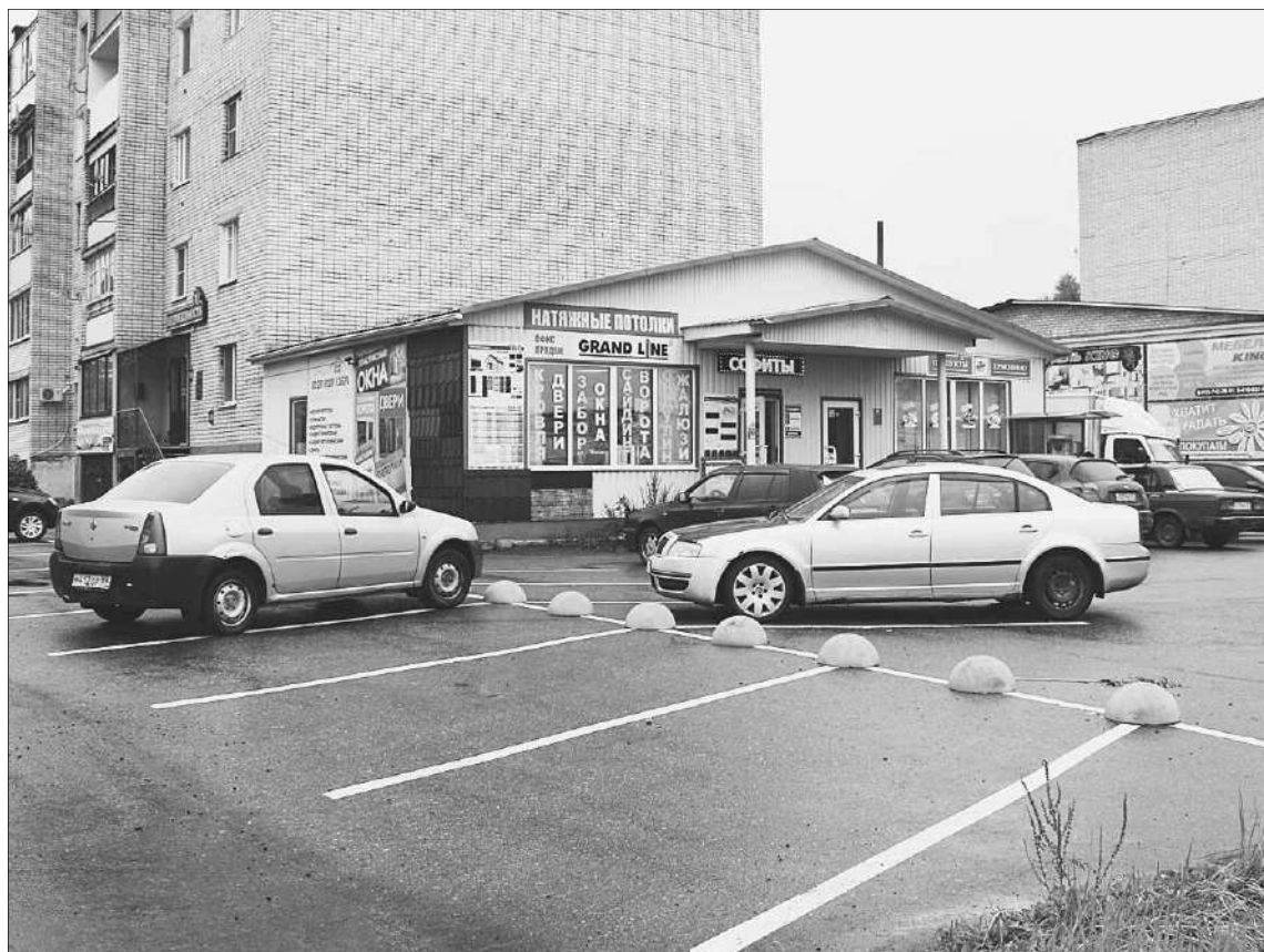
Переход в Торопце стал безопасным.

В Ржевском районе будет решена проблема сельского поселения «Успенское». В поселке на улице Заречной и в деревне Васюково отремон-