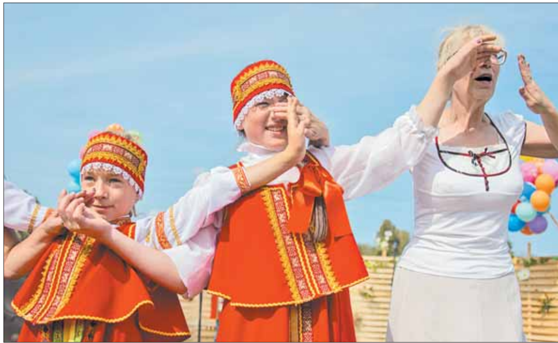
Какой же праздник без песни и хора.

И начались гулянья задолго до официального открытия в 13.00. Уже в шесть утра рыбаки закинули удочки, в восемь в чисто поле вышли участники конкурса пахарей. А за несколько часов в Кокошкине жители и гости успели и соленья-варе-