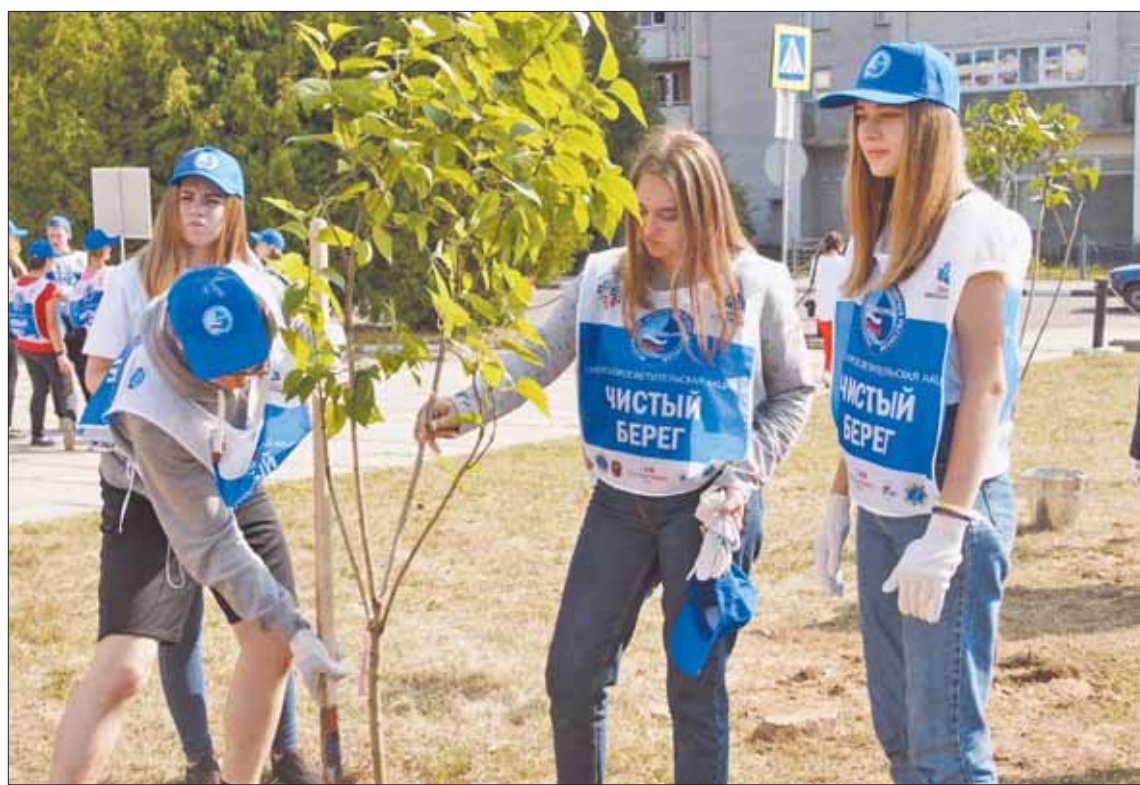
Рядом с ДК «Современник» появилась аллея Памяти.

Порядок наводили тверские и конаковские школьники, студенты тверских колледжей имени Коняева и сервиса и туризма