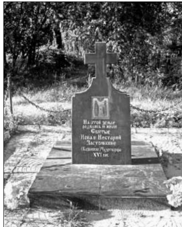
Памятный крест в честь святых Ионы и Нектария Застолбских.