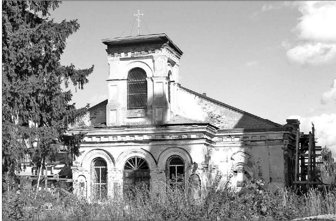
Церковь в честь иконы Божией Матери «Взыскание погибших» в Кузнецове.