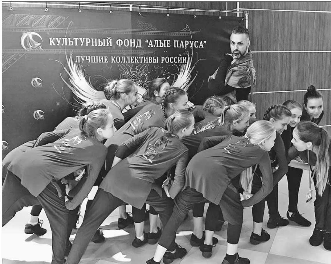
«Танцомания» на фестивале в Сочи.

В прошлом году в Сочи был танцевальный всероссийский конгресс, который проводил фонд «Алые паруса». Я возил туда своих детей, и мы вошли в пятерку лучших танцевальных групп России. На всех конкурсах, в Москве, Питере, Рязани, Казани, Дагомьсе, мы получаем Гран-при. Благодаря студии обо мне стали узнавать, приглашать на постановки. Как-то на одном из конкурсов оказалось сразу пять моих номеров, которые привезли коллективы из разных городов. В самодеятельных танцевальных и театральных коллективах я работаю как эстрадный, ставлю номера, где есть определенный сюжет, колоритные образы. В такой стилистике мало кто работает. Сейчас большинство