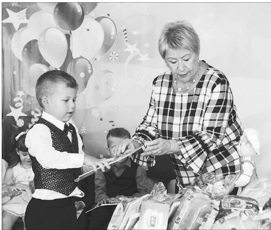
Подарки от ЗАО «Хлеб».