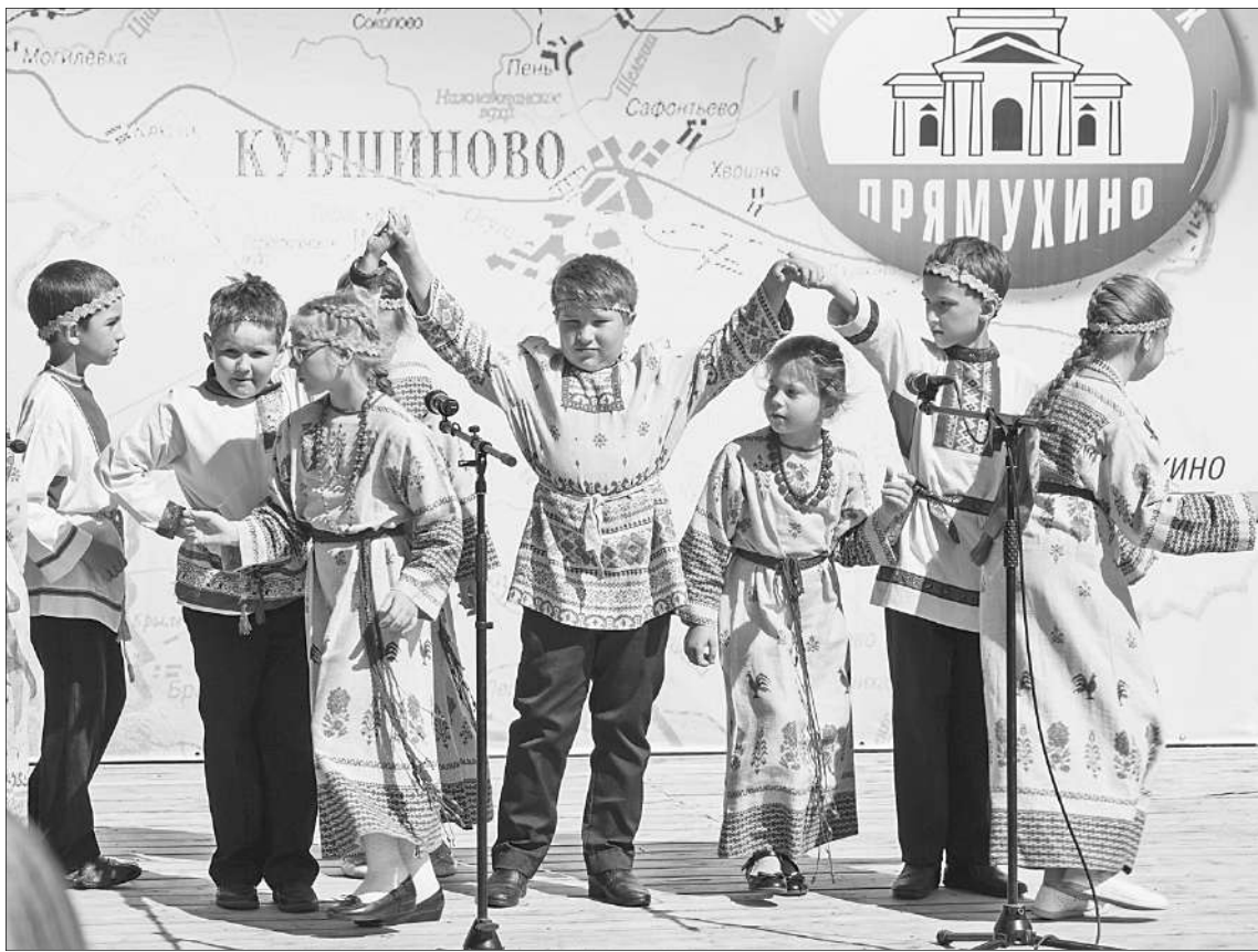
Ансамбль «Зернышко» добился первых успехов.