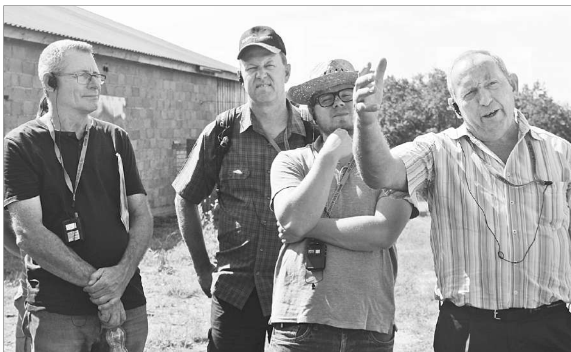
Швейцарские фермеры увидели в Вышневолоцком районе... Альпы.

дены работы на водопроводных сетях в деревнях Топорово, Устровка и селе Старое Сандово, отремонтированы колодцы в деревнях Большое Малинское, Плосково, Глебени, Сушигорцы, Батиха. Кроме того, модернизирована система уличного освещения в селе Тухани, деревнях Кресты и Ладожское.