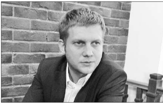
Борис Корчевников.

Во время фестиваля «ТЖ» удалось побеседовать с известным телеведущим и руководителем общественного православного канала «Спас» Борисом Корчевниковым.