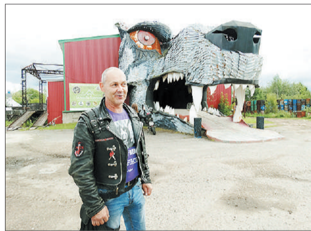
У байк-центра «Волчье логово».

До Дома ремесел, следующего этапа нашего маршрута, ехать недолго. Здесь, в доме на улице Комин-