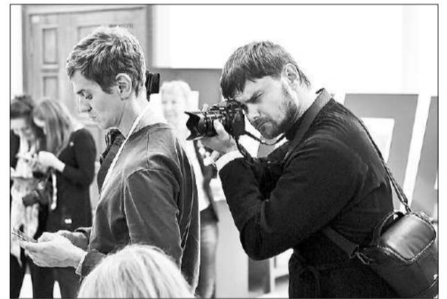
Работа есть работа.