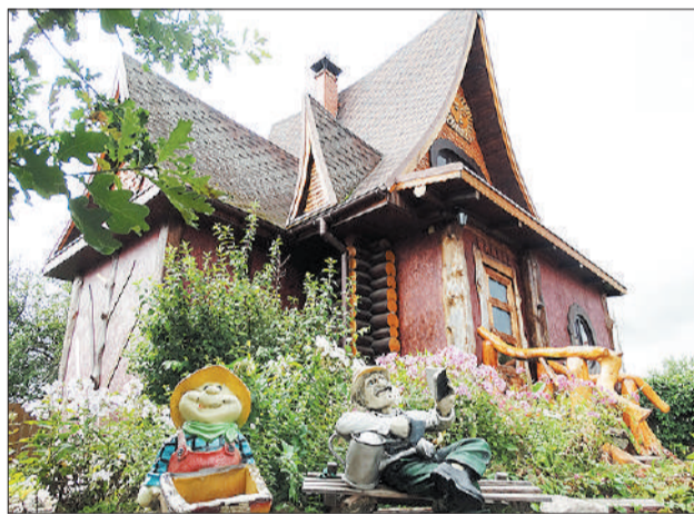
Усадьба Бабы Яги.