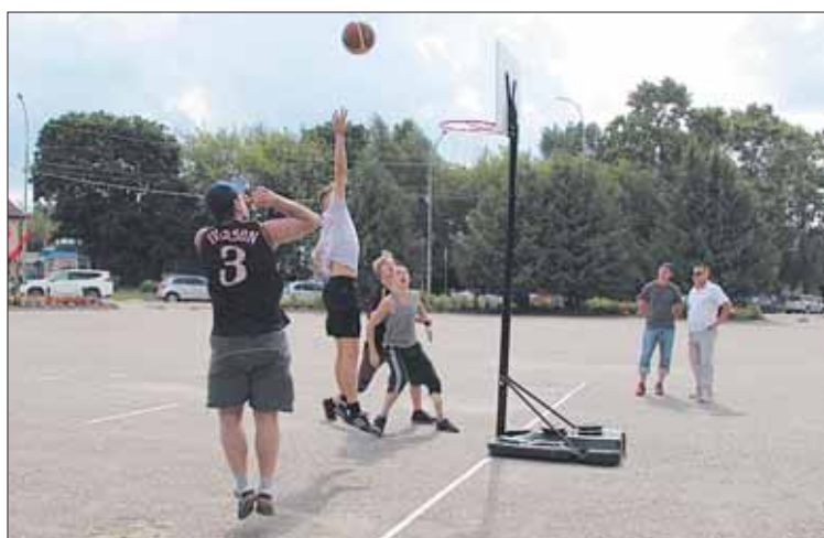
В праздничной программе соревнования по стритболу.

Обладая богатым наследием, муниципальное образование сегодня решает важные задачи, целью которых является повышение благополучия жителей.