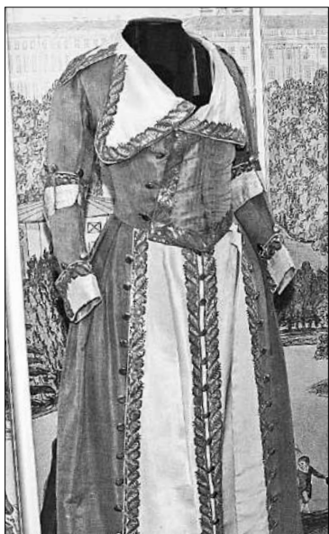
Тот самый мундир.

ный комод, над которым на стене висит портрет императрицы работы Дмитрия Левицкого.