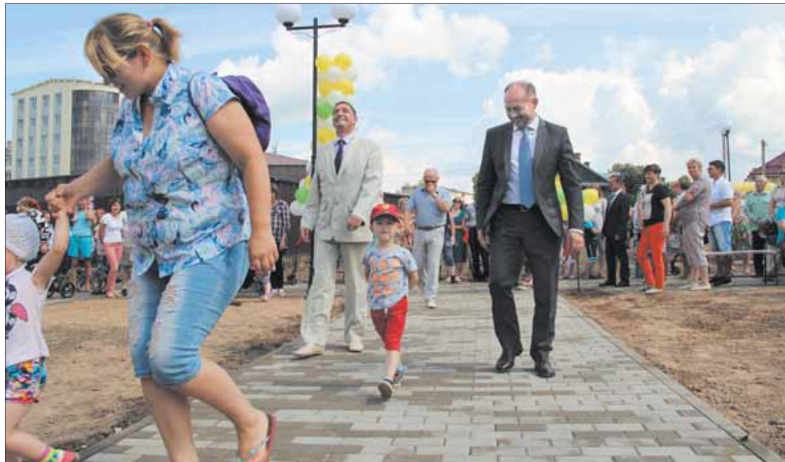
В День города и района праздничная атмосфера царит с самого утра.