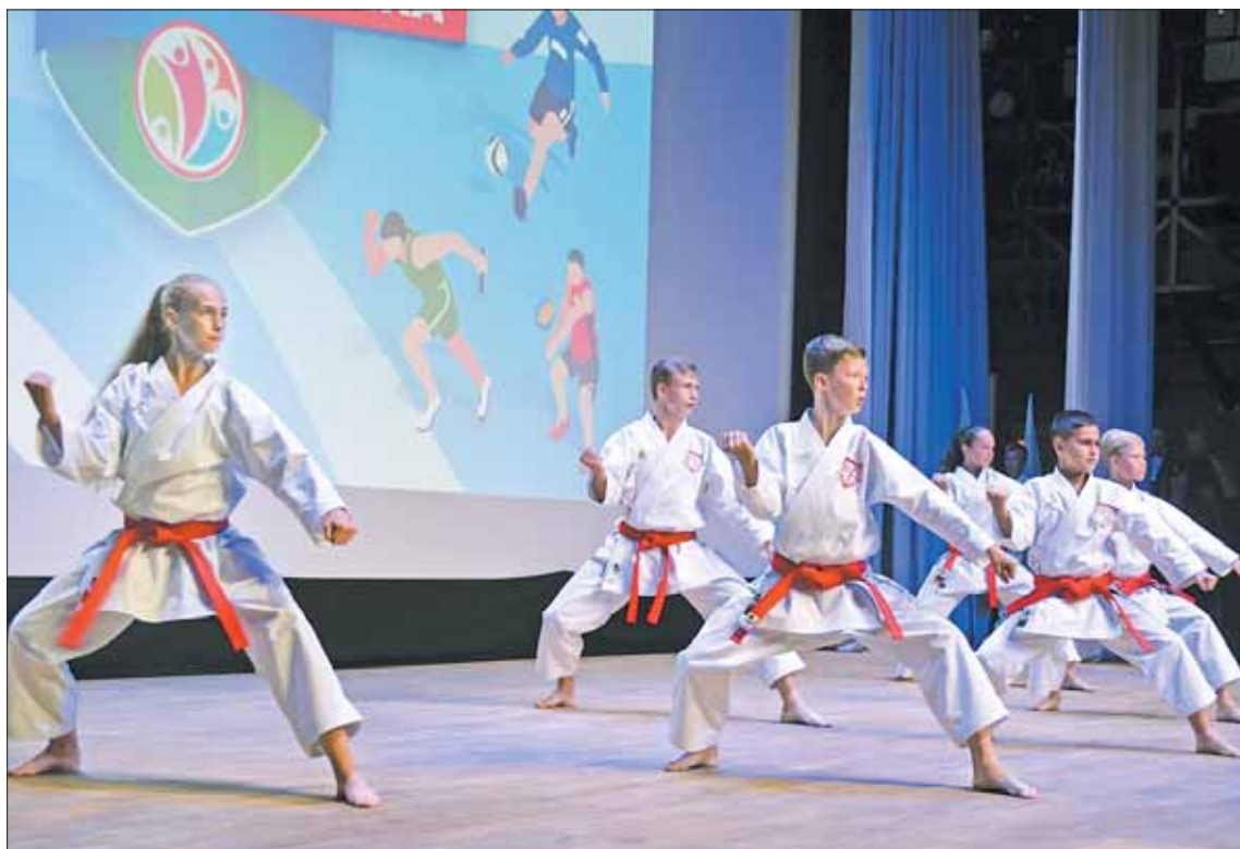
Показательное выступление воспитанников федерации каратэ.