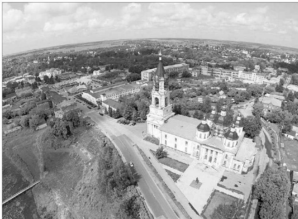
Скоро памятники Кашина можно будет просканировать.

Если бренд лихославльского края «Калитка», то в Кашинском районе уже давно и прочно «прописался» Всенародный фестиваль каши. Но, конечно же, это не единственный «магнит» для туристов. Главный – сам древний город с его историей, старинными хра-