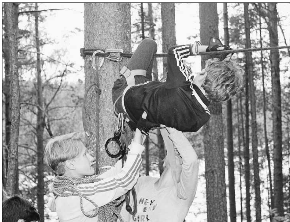
Первый пошел.

Вполне возможно, что кому-то было не по себе оказаться в воздухе, в пяти-семи метрах от земли. На такой высоте находились натянутые троллеи длиной 47 и 60 метров, по которым ребята с ветерком пролетали над