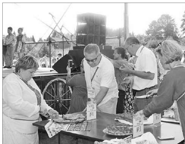
Фестиваль «Калитка» – один из туристических брендов региона.