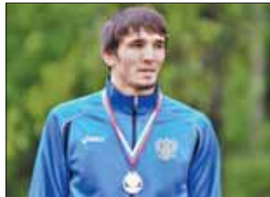
Чемпион России Бекхан Оздоев.