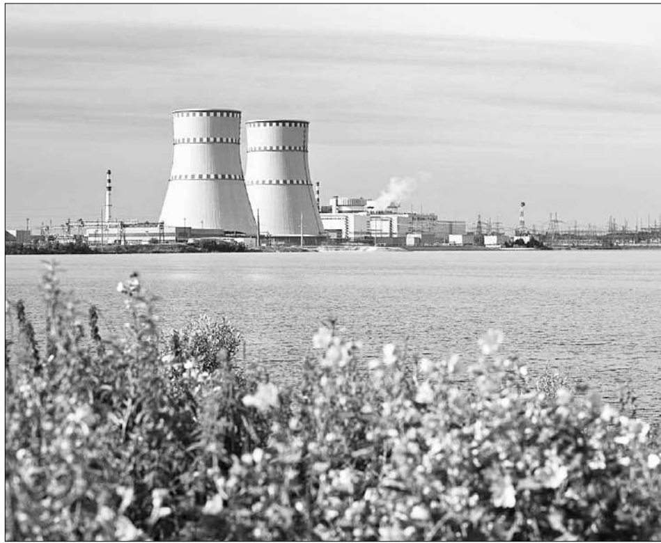
Калининская АЭС.