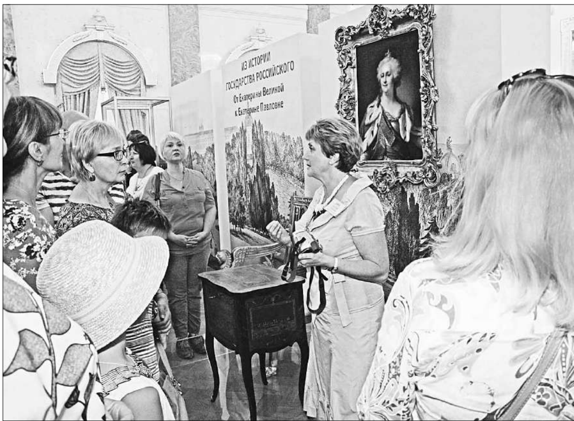
Особенно много посетителей было рядом с комодом.

Одним из центральных экспонатов является подарок жителей нашего города Екатерине Великой — маленький деревян-