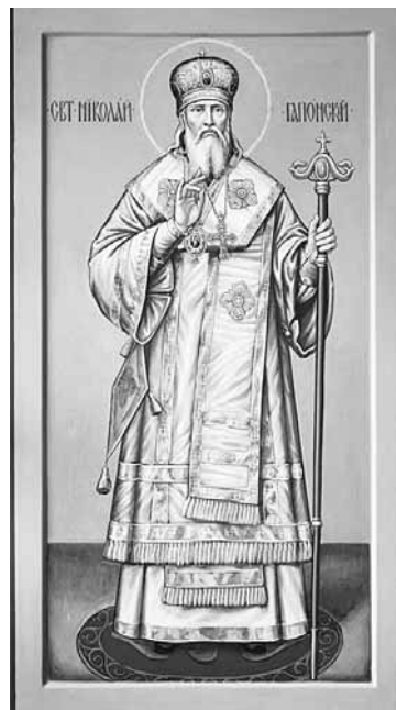
Икона святого равноапостольного Николая Японского

В 1856 году Иван блестяще окончил курс семинарии и был за казенный счет отправлен в Петербургскую духовную академию. Из объявления Святейшего синода он узнал, что