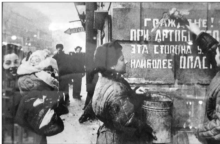
Ленинградцы закрашивают надпись на стене дома, предупреждающую об артобстрелах, после окончательного освобождения города от вражеской блокады.

Когда бабушка жила у нас, она любила, чтобы на столе было несколько сортов хлеба понемногу, и белого, и черного. С какой-то торжественностью, бережно она брала кусочек, держала его в руках и потом не спеша пережевывала, ощущая вкус каждой крошки. На столе могли стоять разные блюда, но хлебушек был всего вкуснее.