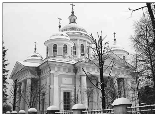
Спасо-Преображенский собор Торжка.