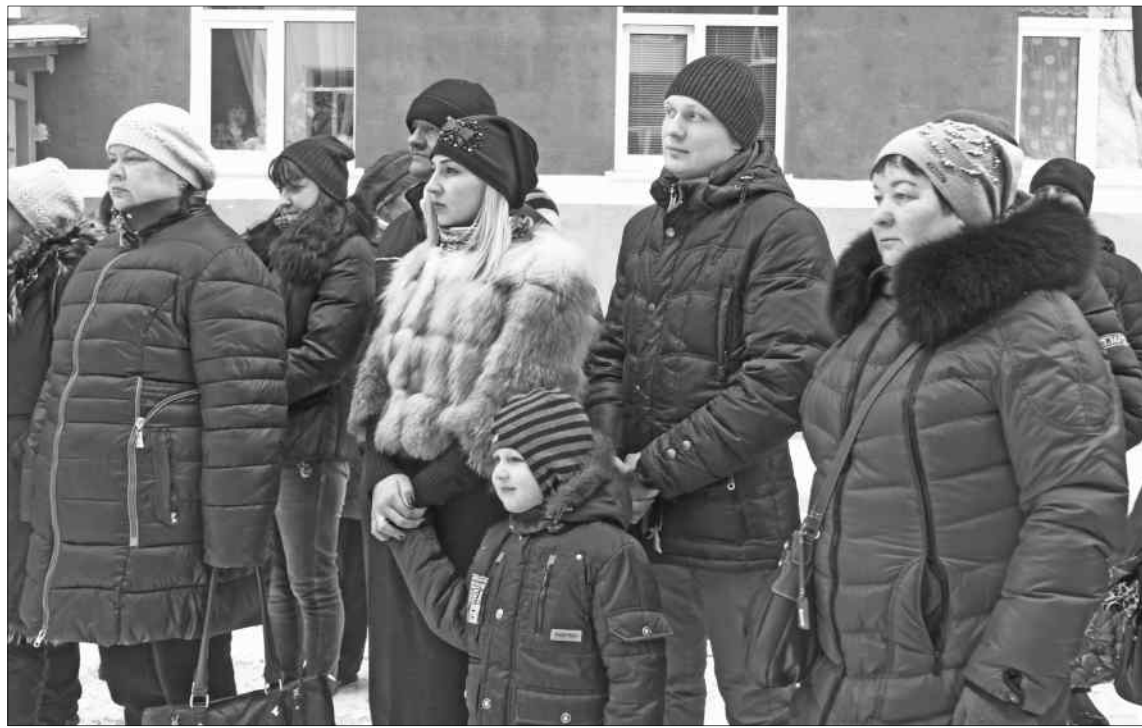
Общий праздник собрал будущих соседей.