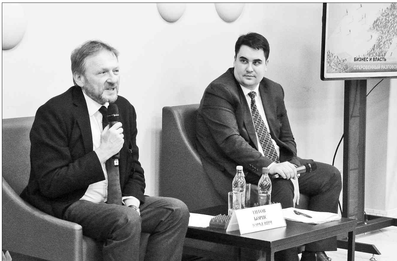
Борис Титов и Антон Стамплевский.

Визит. Борис Титов присмотрел в Твери место для штаб-квартир крупных компаний