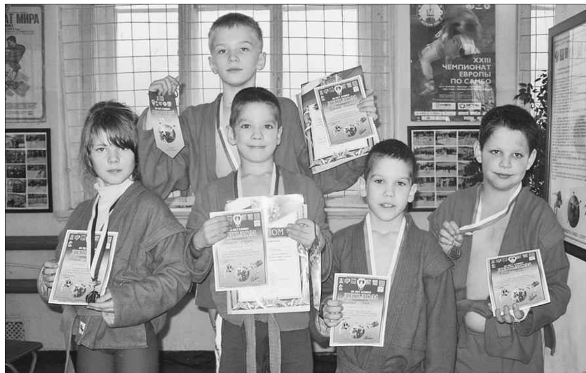
В поселке Калашниково воспитывают чемпионов.