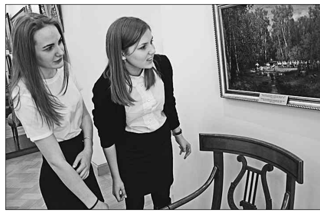
Проект «Нас пригласили во Дворец» продолжается.

Конечно, не осталось незамеченным такое важное для Верхневолжья событие, как принятие Стратегии духовно-нравственного воспитания детей в Тверской области на 2018–2027 годы.