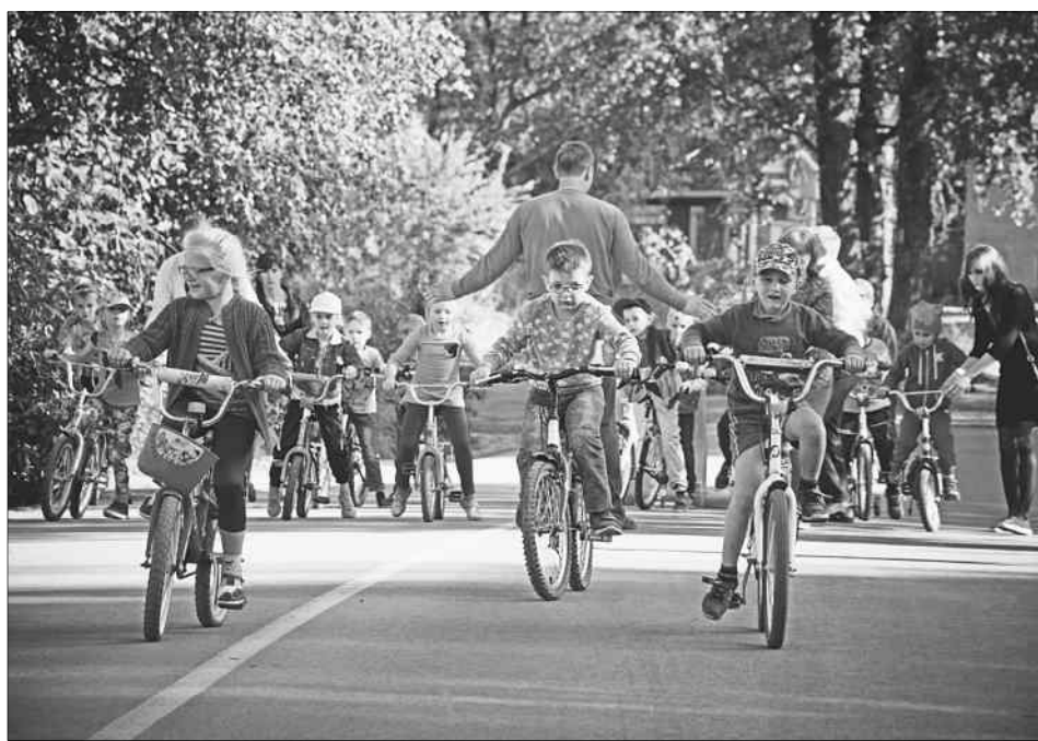
На открытии новой дороги по улице Коммунаров в 2017 году.