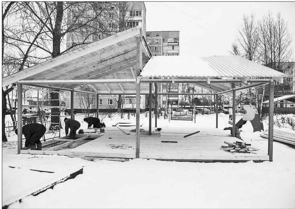
Строительство прогулочной веранды в детском саду «Улыбка».

Так, в УСОШ №1 ведется замена дверей и окон,