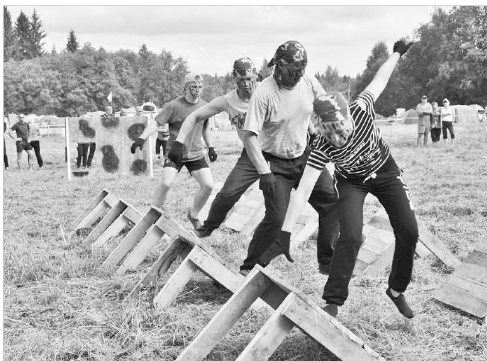
Утренняя зарядка на «Сандовских рассветах».

Задание на лето губернатор Игорь Руденя дал такое: «Первое и главное – обеспечение безопасности. Второе – отдых должен быть содержательным, а мероприятия – соответствовать Стратегии духовно-нравственного воспитания детей в Тверской области».