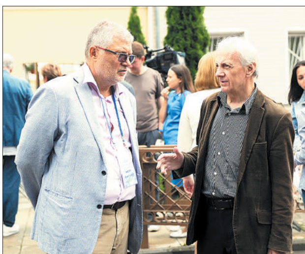
Юрий Поляков и Геннадий Красников.

— В Отечестве нашем серьезно стоит проблема с первичным поэтическим образованием, — констатирует писатель, драматург, главный редактор «Литературной газеты» Юрий Поляков. — Во времена моей литературной молодости подросток мог полностью окунуться в жизнь литобъединений, которые существовали по-