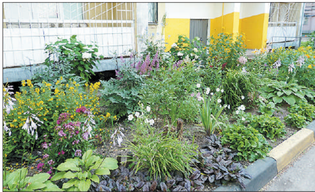
Возле каждого подъезда — цветник.