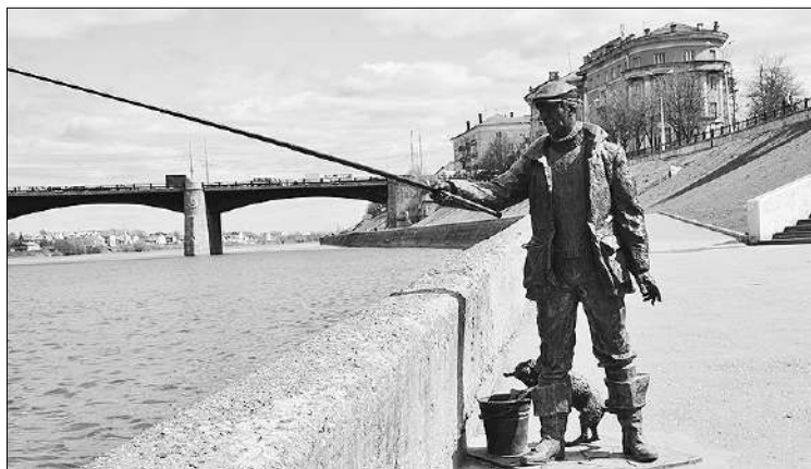
Теперь на набережной рыбак рыбака видит издали. Автор реалистичного образа – скульптор Ирина Макарова.

Самый тяжелый по восприятию памятник – это тот, что посвящен жертвам политических репрессий у бывшего здания НКВД, теперь – мединститута. И тоже интересный момент: год назад я показывала Тверь шведской журналистке. Она долго стояла у этого памятника, а потом заметила, что на большой клумбе вокруг него нет цветов.