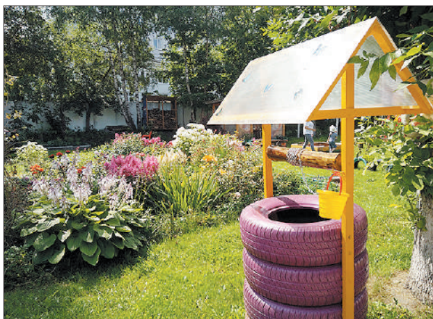
Арт-объекты здесь на каждом шагу.

— Вот тут хочу золотистым обвести, — делится Надежда Михайловна. — А еще в этом году мы попали в городскую программу по благоустройству дворовых территорий, вместо протоптанной дорожки будет асфальтированная, и заборчики поставят по периметру дома, а возле подъездов — скамейки и вазоны. И ждем капитального ремонта кровли, который назначен на этот год. Со своей стороны мы все подписи и документы собрали.