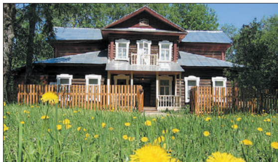
«Дом поэтов» в Градницах готов встретить гостей Гумилевского фестиваля.