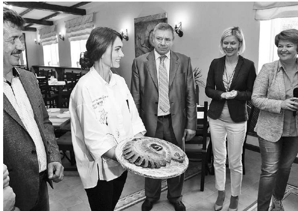
Гостей на ферме встречали пирогом, испеченным в форме улитки.