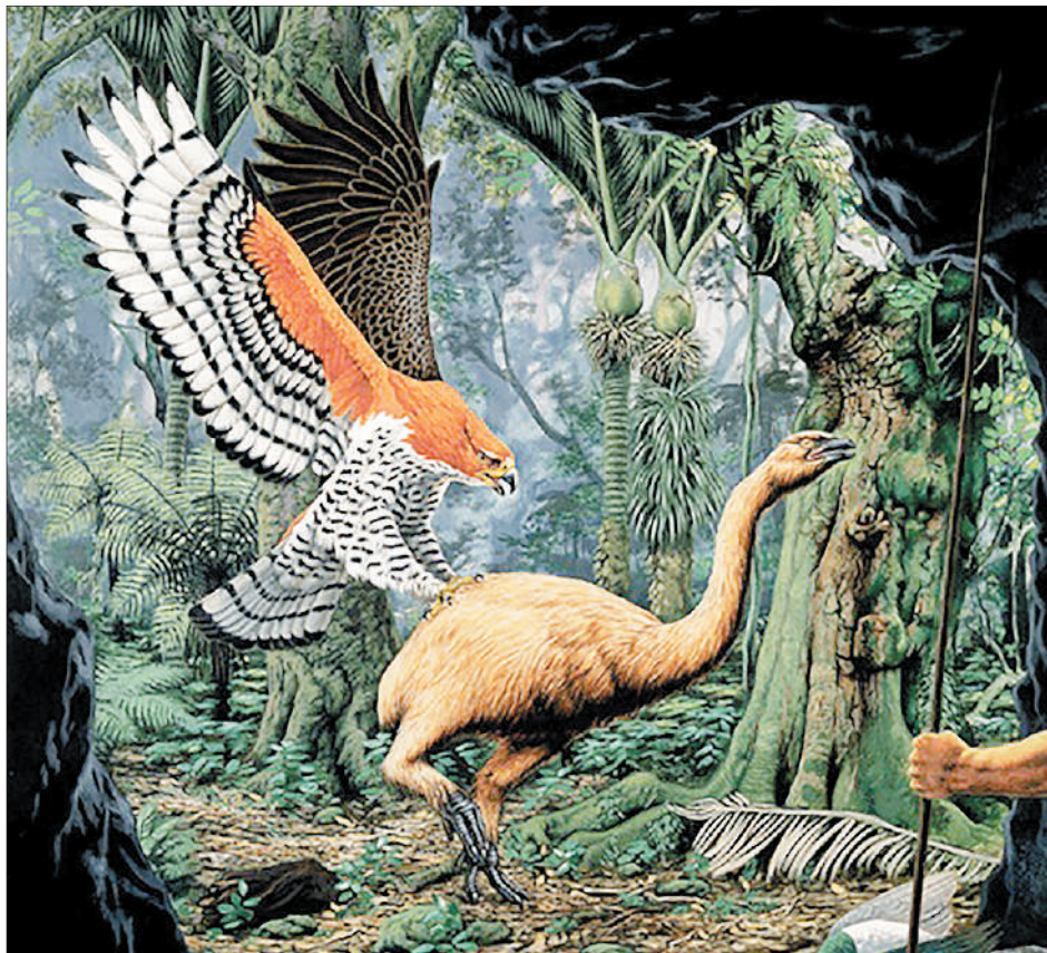
Основной добычей орла Хааста были нелетающие моа.