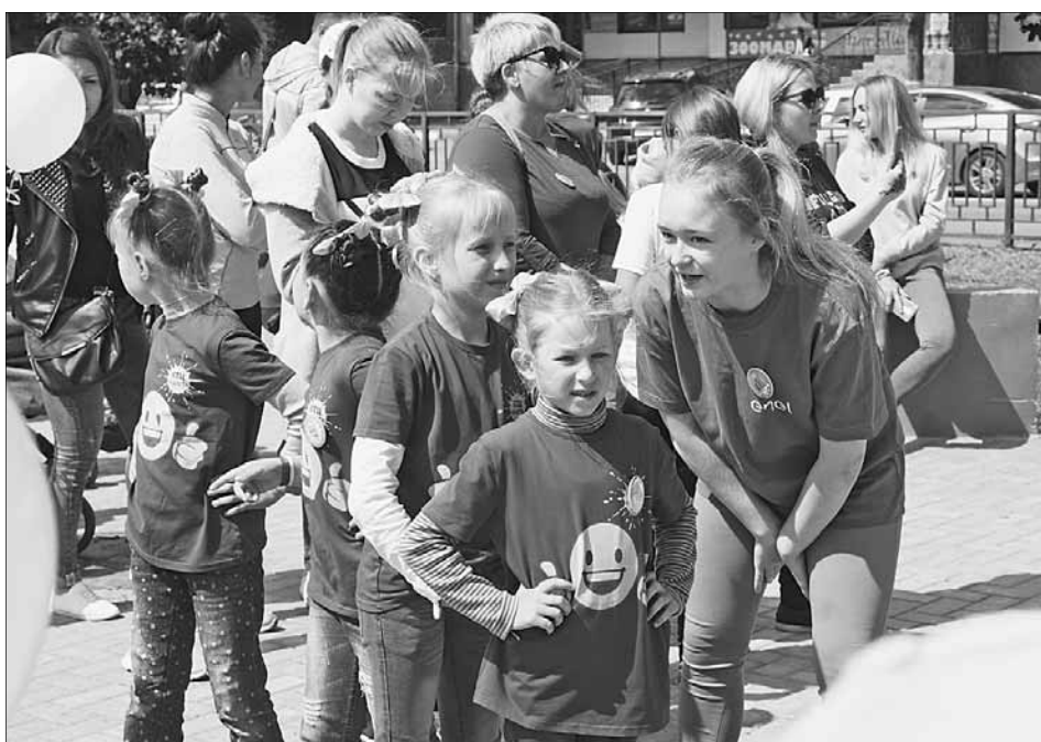
Акция «За здоровый образ жизни».

Среди самых активных участников программы – Андреапольский район. В этом году там будет реализовано 10 инициатив. Благодаря ППМИ в райцентре будут продолжены капитальный ремонт участка водопровода на улице Театральной и модернизация системы уличного освещения. В сельских поселениях – Андреапольском, Аксеновском, Бологовском, Волоцком, Торопецком, Хотилицком – отремонтируют кровли клубов, дорогу, благоустроят пожарные водоемы, приведут в порядок ограждения кладбищ. В