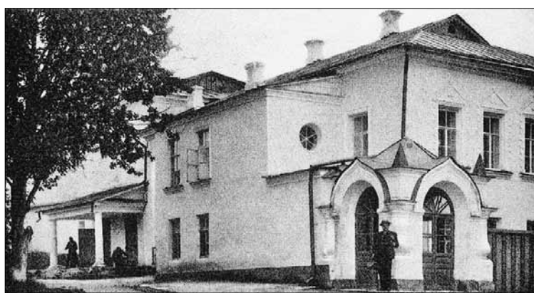
В архимандритских покоях в 1919 г. расположился краеведческий музей.