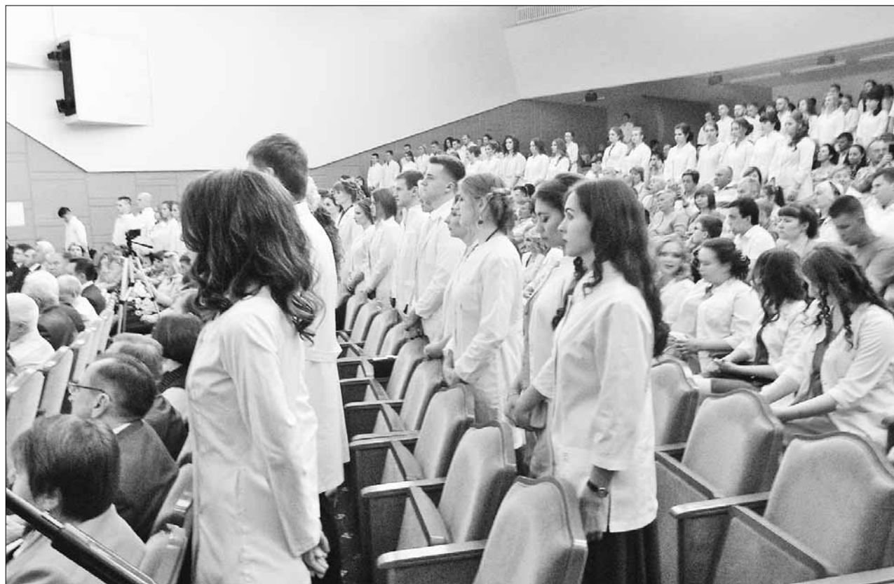
Будущие врачи поклялись свято исполнять свой долг.