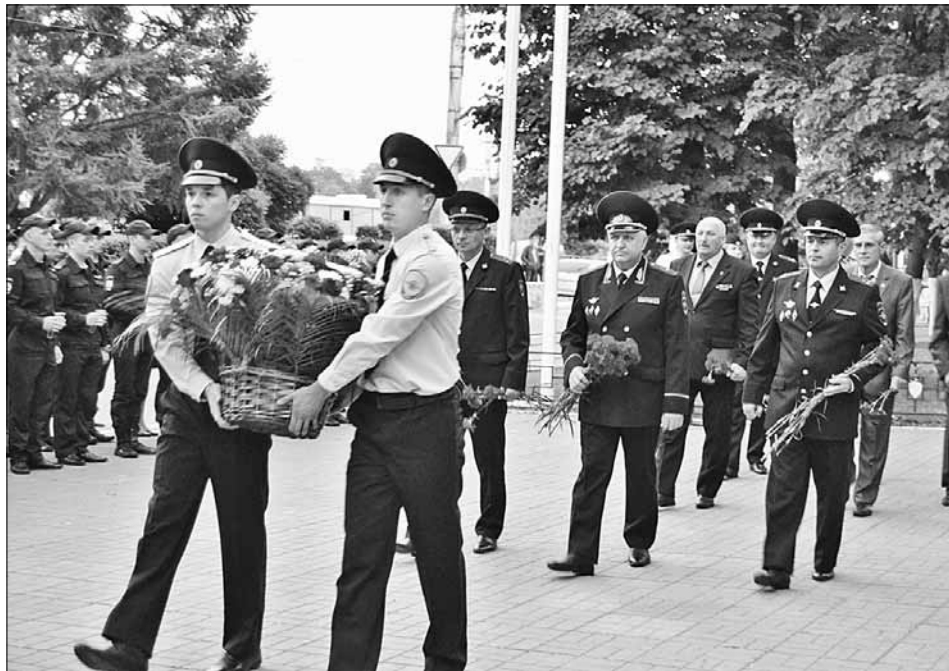
Возложение цветов к мемориалу на площади Мира.

22 июня, ровно в 4 часа... В эту короткую летнюю ночь скорбная память войны переполняет сердца. В каждой семье говорят о пережитом в те страшные годы, о родных и близких, не вернувшихся с фронта.