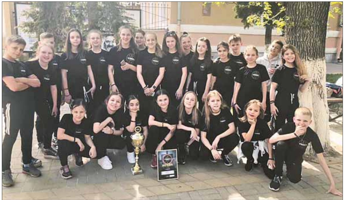
Они говорят: танец – это жизнь!

Итак, в студии пять групп: это малыши от 3,5 года; дети