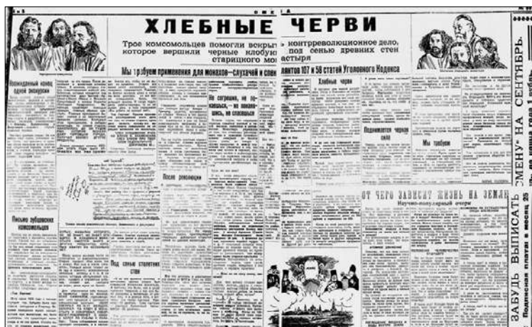
Статья в молодежной газете «Смена» Б. Полевого за 1928 г.