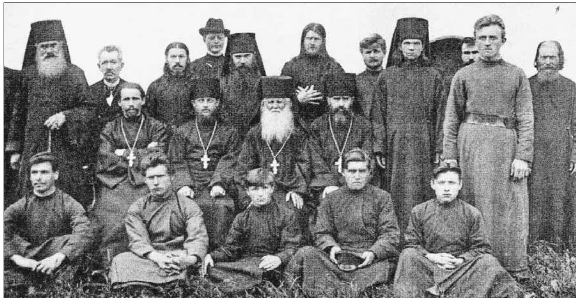
До 1917 г. в Старицком Свято-Успенском монастыре было 11 монахов и 10 послушников.

Через некоторое время президиум Старицкого уездного исполкома заслушал председателя коммунотдела Словоходова. «Пламенный революционер» предлагал ликвидировать Старицкий монастырь и устроить в нем гостиницу, столовую и постоялый двор.