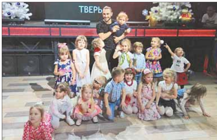
А мы уже артисты!

– с 6 лет; юниоры – с 8 и подростки – с 12 до 15. Ну а ребята постарше – в молодежной группе. Поток студийцев все прибывает. Почему же «Тодес» так популярен?