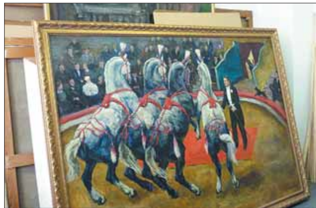
В фонде живописи — около 3 тысяч экспонатов.

Хранитель обращает наше внимание на Евангелие из древнейшего храма Твери — Белой Троицы. Оно было напечатано в 1688 году, в царствование Иоанна и Петра Алексеевичей, по благословению патриарха Иоакима. Написано оно уставом — медленным и торжественным письмом, с буквами, стоящими раздельно друг от друга.