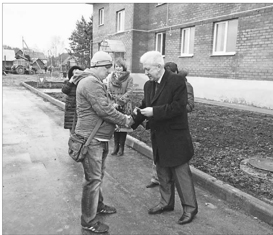
Вручение ключей от новых квартир в поселке Победа.