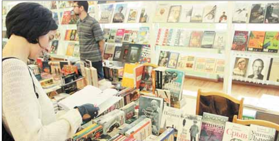
Тверитян ждет встреча с самыми яркими книжными новинками.