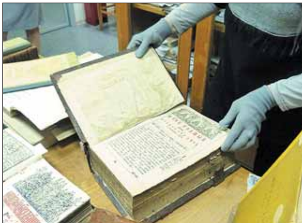
Самое древнее издание в коллекции датируется первой четвертью XVI века.

фонды, которые сложились не так давно. Один из них — фонд редких изданий, куда мы направляемся из реставрационной мастерской. Нас встречает его хранитель Людмила Середина.