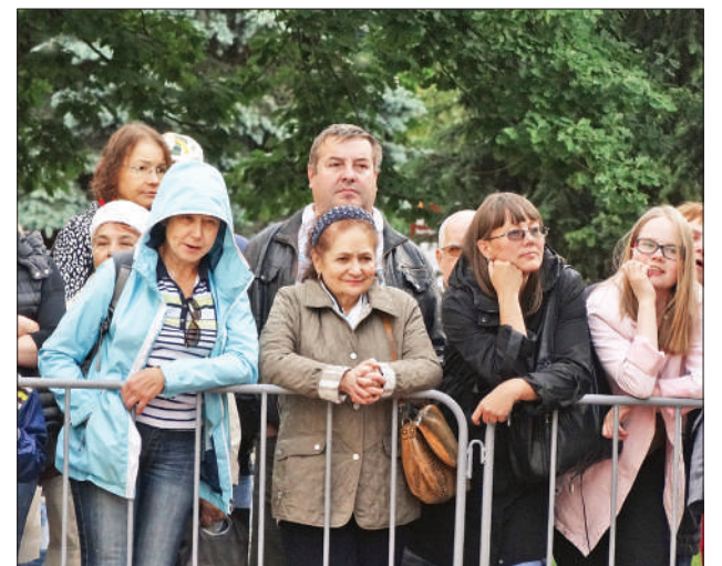
Благодарные слушатели.

Футбол в этот вечер был, естественно, таким же главным героем, как и музыка Чайковского. Перед исполнением второй части и финала Симфонии №5 стало известно,