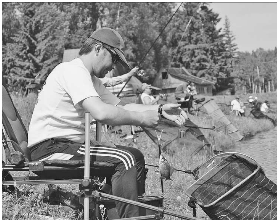
Кубок Тверской области по рыболовному спорту.