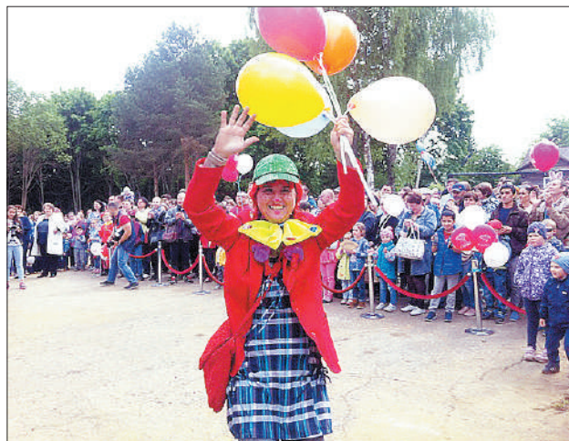
В ожидании виновницы торжества.