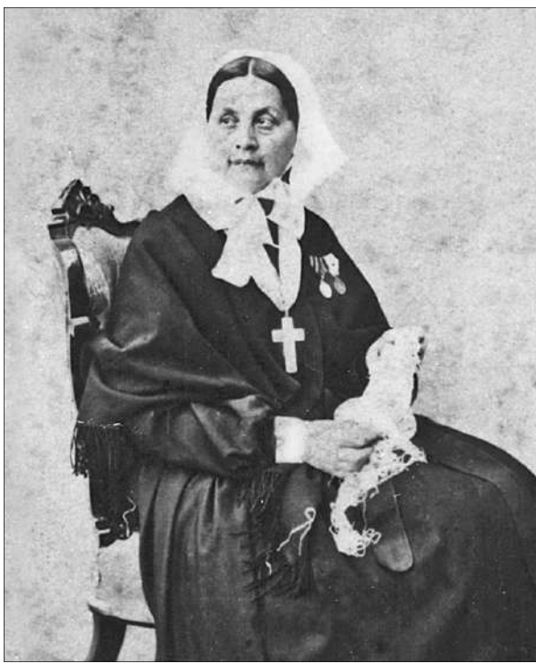
Екатерина Бакунина посвятила себя служению идеалам сострадания и любви

Тверская дворянка, дочь губернатора Санкт-Петербурга, Екатерина Бакунина вошла в историю как одна из первых сестер милосердия, участниц обороны Севастополя в период Крымской войны, спасавших на полях сражений раненых бойцов. Почти 30 лет