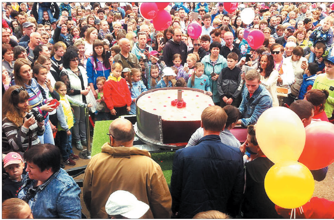
Лакомства хватало всем.

– В «Книгу рекордов России» начиная с 2014 года внесено около двух тысяч самых разнообразных