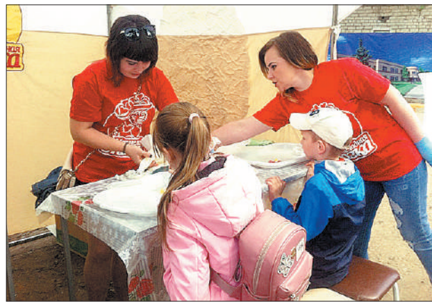
На мастер-классе можно было научиться украшать мармеладных мишек.

ВКУСНЫЙ РЕЦЕПТ. Мармелад можно приготовить самостоятельно. Рецептов домашнего мармелада множество. Вот, например, золотистый мармелад из лимонов. Для приготовления четырех порций необходимо: 2 литра воды, 4 стакана сахара и 4 лимона. Нарежьте лимоны и аккуратно извлеките семена. Но не выбрасывайте их, а заверните в марлю. Лимонные дольки положите в кастрюлю, залейте водой и положите туда узелок с семечками. Оставьте все настаиваться на протяжении суток. На следующий день доведите массу до кипения, ослабьте огонь и варите еще 50 минут. Добавьте сахар и подержите на огне приблизительно 15 минут, помешивая и снимая пенку. Протестируйте продукт: если капля смеси будет застывать на холодной тарелке – мармелад готов, и кастрюлю можно снимать с огня. Разлейте горячую смесь по емкостям, оставляя чуть-чуть места сверху каждой ячейки. А если не хотите возиться с кастрюлями – просто купите мармелад в «Мармеладной сказке». Вам понравится!