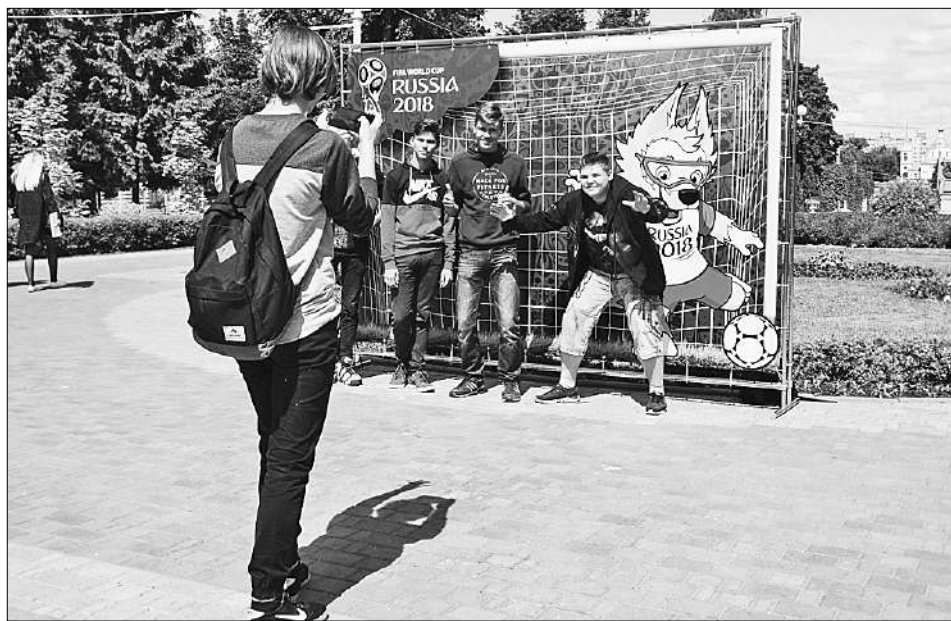
В городском саду в Твери можно сфотографироваться с главным символом ЧМ-2018 Волком Забивакой.