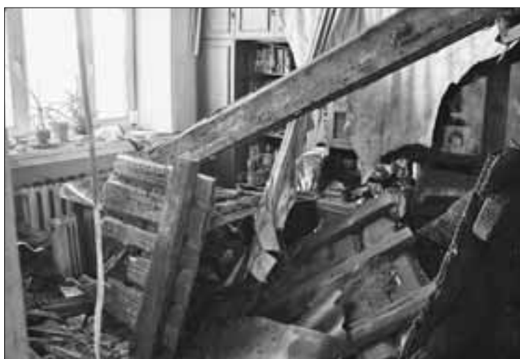
В таком состоянии находится квартира после обрушения потолка.

нашей УК, жильцы не обращались к нам по поводу ремонта крыши ни разу. Крыша там нормальная, она и сейчас не течет. Что касается капитального ремонта, то в соответствии с сегодняшним законода-