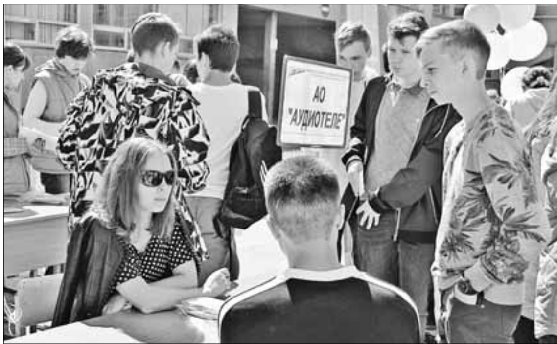
На ярмарке многие ребята нашли себе работу.

Надо отдать должное сотрудникам центра занятости населения города Твери: они провели большую работу, вместе со своими социальными партнерами – работодателями областной столицы и Калининского района. Убеждать их брать подростков на временную работу