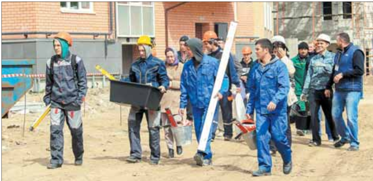
Техзадание получено, фронт работ намечен.

Какая температура должна быть в помещении при проведении штукатурных работ? В каком