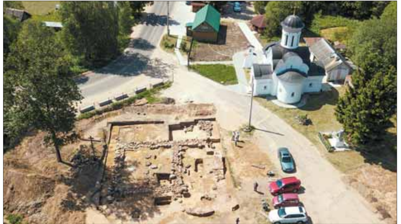
Место раскопок, снятое с беспилотника.