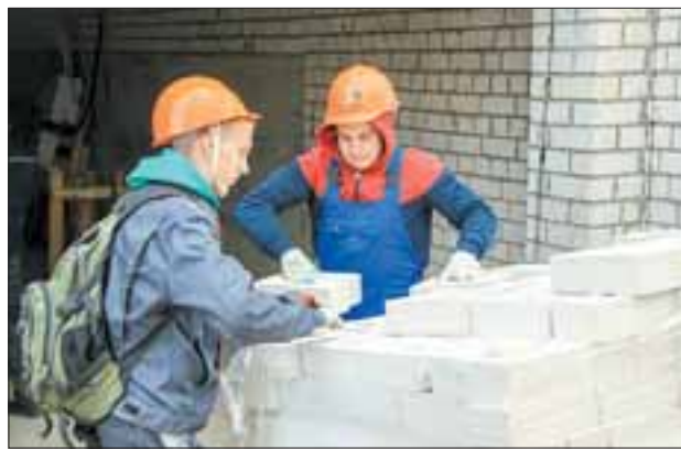
Студенты не упускают шанса подсмотреть секреты мастеров.

Беседа сопровождается ритмичными хлопками: так шлепает о стену каждая порция штукатурки, если рука, что держит