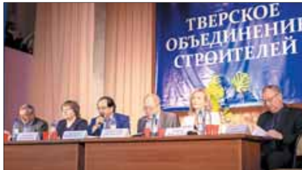
Участников конкурса приветствовали асы строительной отрасли и представители учебных заведений.