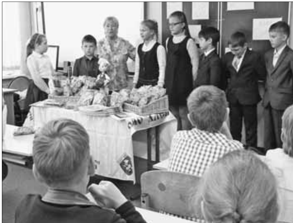
На уроке в 3«Б» никто не скучал.