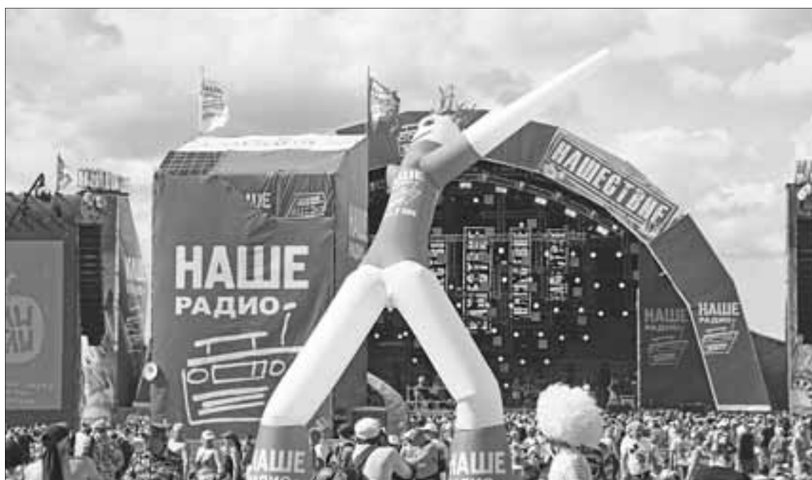
В прошлом году один из самых популярных рок-фестивалей в стране посетил около 200 тыс. человек.

трально-Лесного государственного природного биосферного заповедника. А федеральный туроператор «Вокруг Света», с которым Министерство туризма Тверской области подписало соглашение о сотрудничестве, включил в свою программу тур «Историко-гастрономический очерк» по Весьегонску, Лихославлю, Бежецку и Твери.