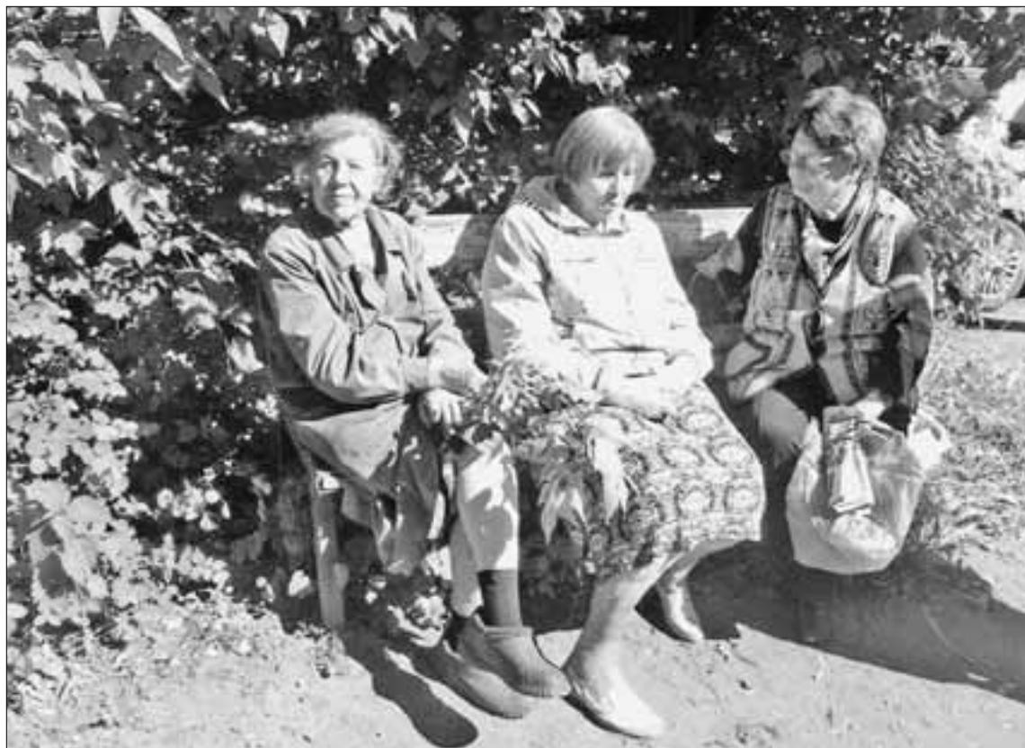
Жильцы дома №13а.

душевая и два унитаза. Мебели, конечно, никакой.