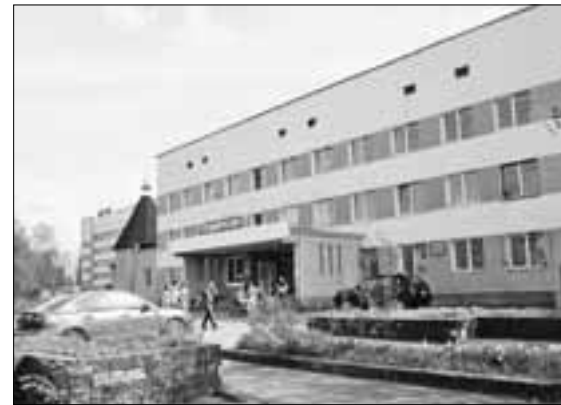
Центральная медико-санитарная часть Удомли.

В рамках реализации проекта «Бережливая поликлиника» Центральная медико-санитарная часть Удомли получила современную передвижную амбулаторию – мобильный лечебно-профилактический комплекс «Диагностика».