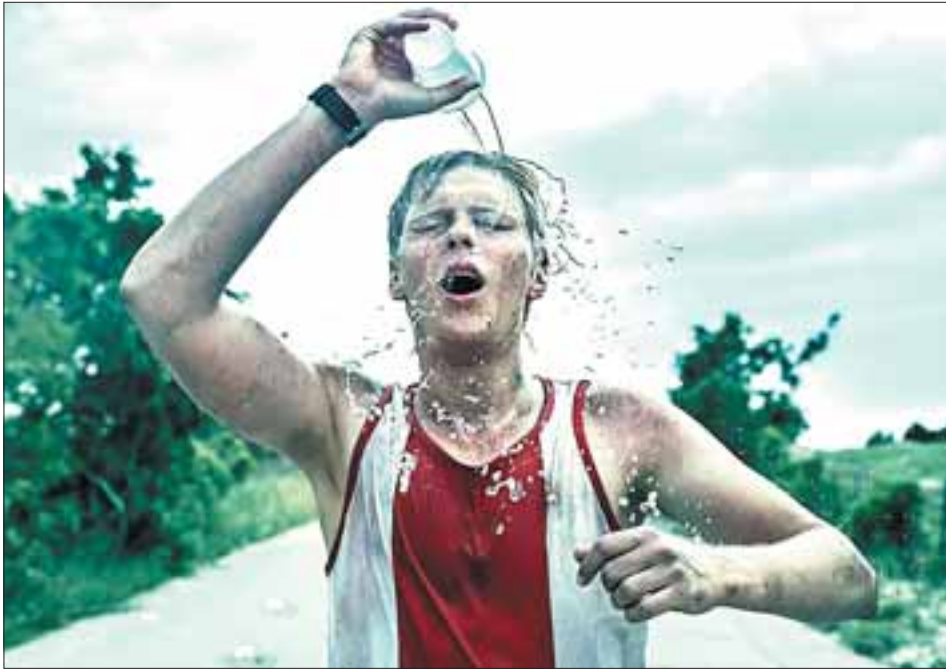
Кадр из фильма «Лучше всех».