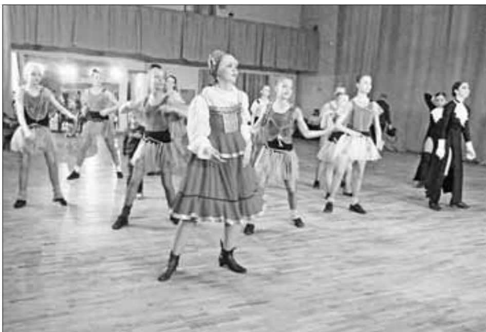
Фееричный мастер-класс от лучших танцевальных коллективов.

Многим запомнился праздник в честь 50-летия со дня присвоения звания «народный» ансамблю танца «Тверичане», который носит имя Евгения Комарова. Руководитель Наталья Загороднюк завершила, что коллектив стремится сохранить тради-