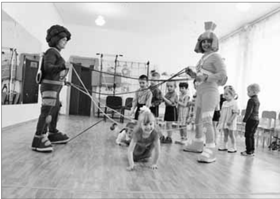
С фиксиками детям было интересно.

для ребят комплекты постельного белья, игрушки и другие подарки. Они проводят ярмарки-продажи, где все представленные товары сделаны руками работников Тверьэнерго. Вырученная от продажи сумма идет на нужды санатория.