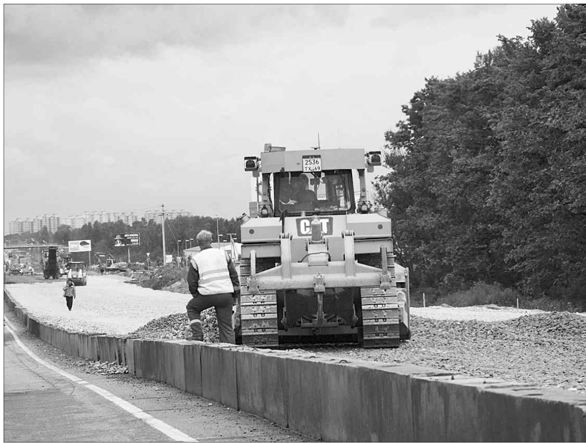
Так строят дороги высокого качества.