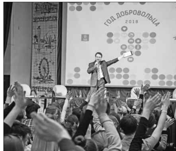
Учиться делать добро готовы!