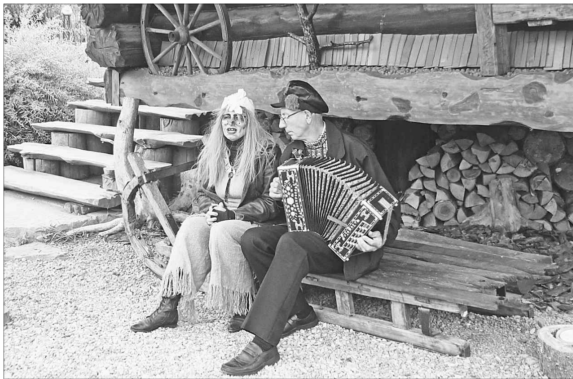
В резиденции Бабы Яги.

Одна из активно развивающихся туристических ниш – частные музеи. В ТОП-15 лучших таких объектов в России, составленный туроператорами,