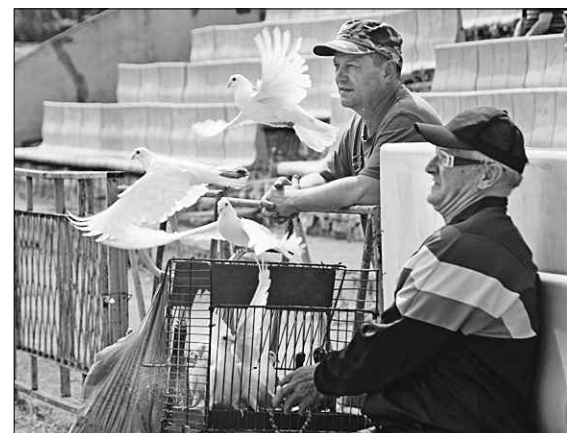
Птицы взлетают по стартовому свистку.

Стартовал последний этап онлайн-продаж билетов на первый в истории российский чемпионат мира по футболу. На сегодняшний день нет сомнений, что на всех матчах ЧМ-2018 будет аншлаг.