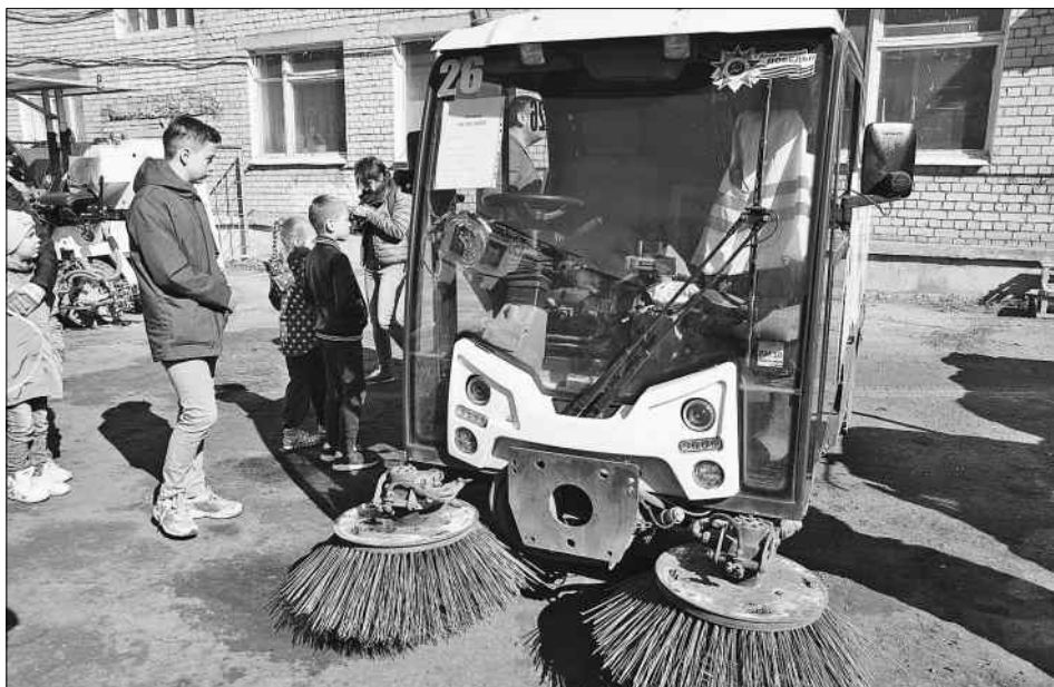
Такая техника стоит как «Феррари».

Мама с детьми, двое молодых ребят, мужчина с мальчиком лет 10, женщина с ноутбуком, собирающаяся вести прямой репортаж с экскурсии для интернет-портала... К воротам МУПа подошли самые разные люди. Кому-то хотелось задать руководству наболевшие вопросы о вечной русской проблеме, кого-то интересовало, полностью ли предприятие обеспечено