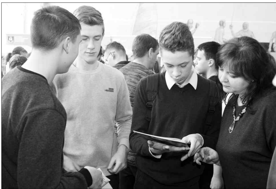
На ярмарках образовательных услуг всегда много молодежи.

— Самым разным, всего их около 70, почти 68% из них — рабочие. Они востребованы на рынке