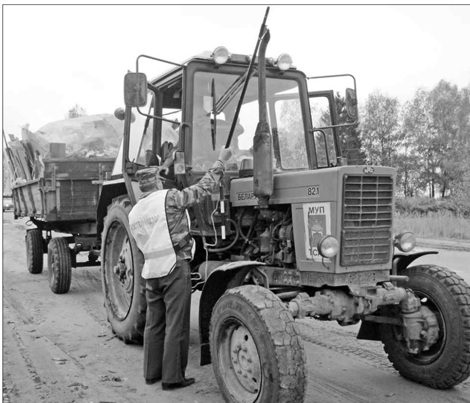
Профилактические рейды проводятся регулярно.

При участии инспекторов Гостехнадзора проводятся профилактические рейды на дорогах Верхневолжья, проверки и техосмотры внедорожной техники, в первую очередь – сельскохозяйственных машин, но также снегоходов и прочего внедо-