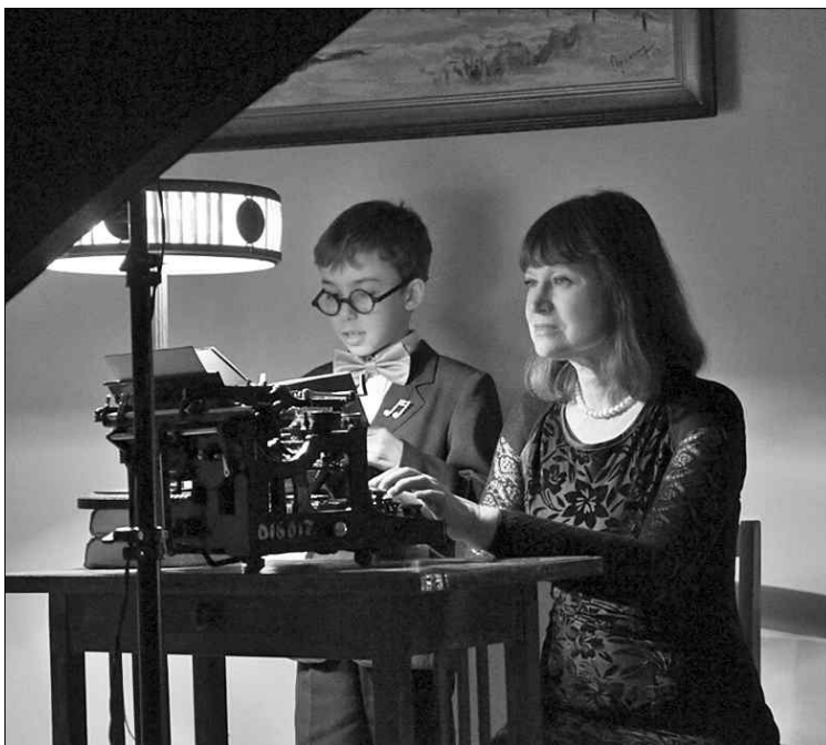
Книга на ночь – это ритуал.