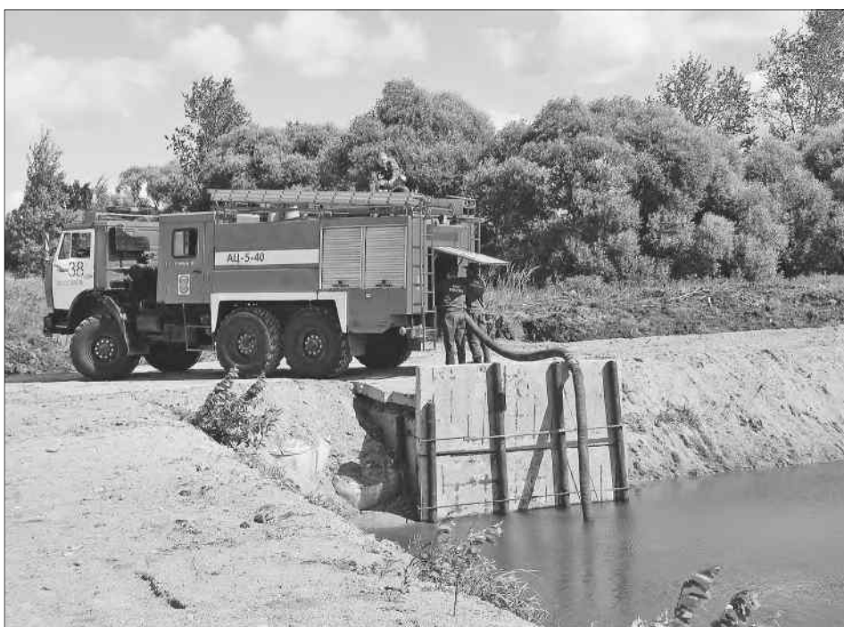
Среди популярных проектов ППМИ – приведение в порядок пожарных водоемов.

Программа поддержки местных инициатив реализуется в нашем регионе шестой год. И каждый строительный сезон приносит сельским поселениям и городским округам – участникам программы – что-то новое и хорошее. Освещение улиц, водопровод, ремонт дороги, спортивную площадку... Выбор за жителями.