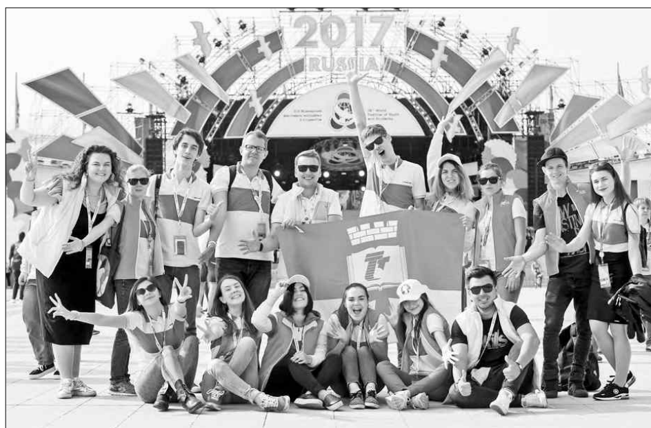
В прошлом году активисты ТвГТУ стали участниками прошедшего в Сочи Всемирного фестиваля молодежи и студентов.