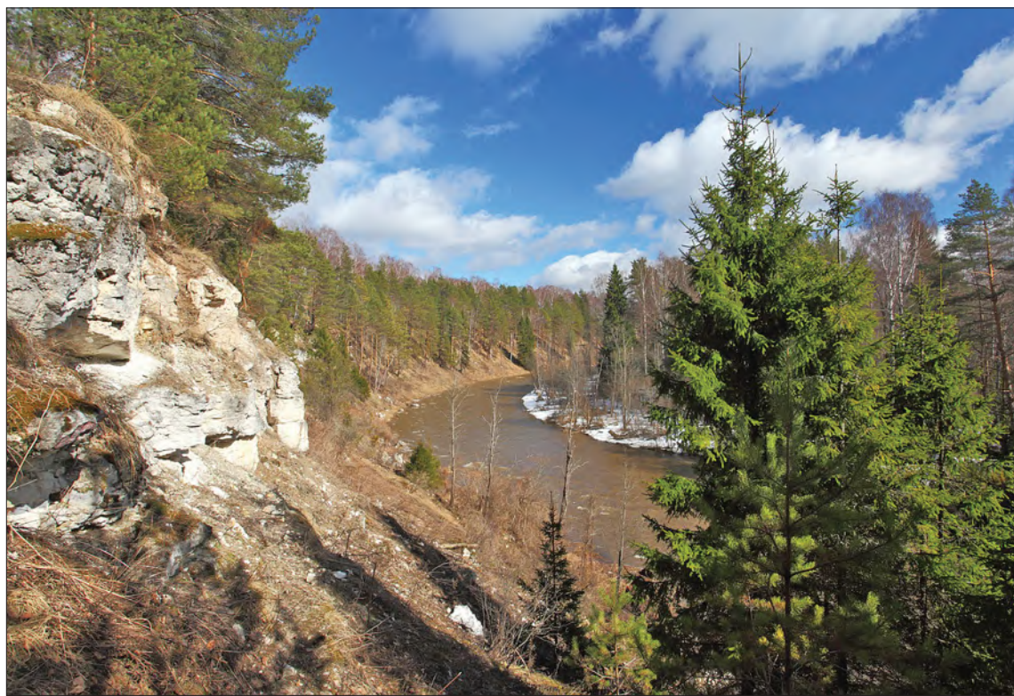
Река Держа и ее берега.