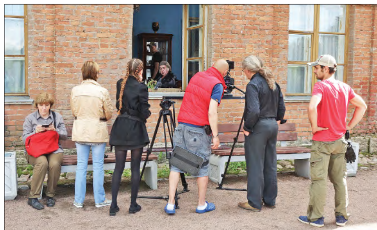
Съемочный процесс.

— До сих пор точно неизвестно, где родился Иван Крылов — в Москве или в Твери. Но я склоняюсь ко второму варианту, ведь именно сюда вернулся его отец с семьей, когда закончил службу в