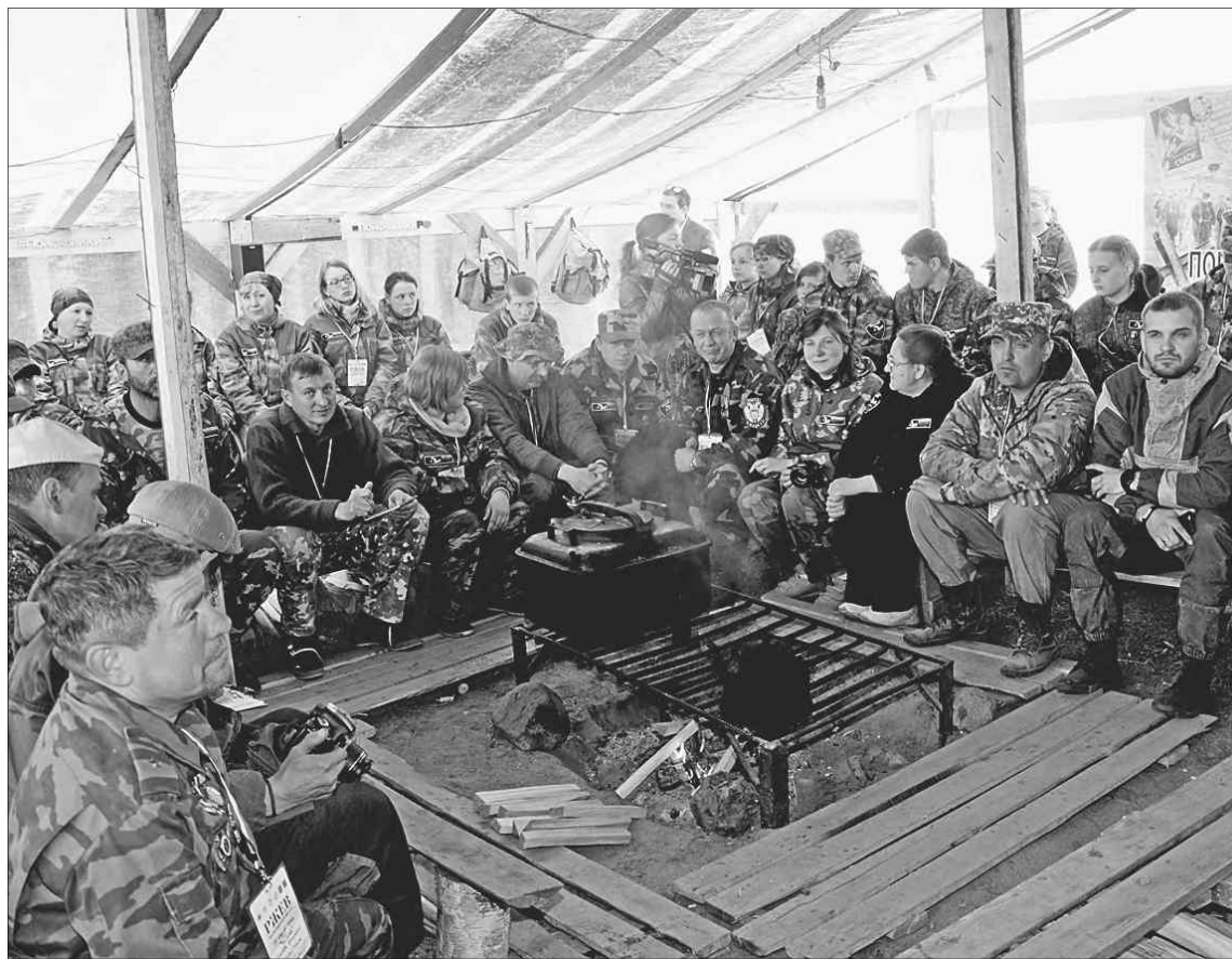
Международная военно-историческая экспедиция «Калининский фронт»-2017.