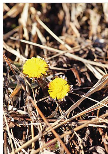
Первая мать-и-мачеха.

сутся каякисты. Один, увидев зрителей, исполнил для нас трюк: раз — и перевернулся вниз головой, вынырнул и полетел дальше. Глазом не успела моргнуть. Алексей же сориентировался, на кнопку нажал.