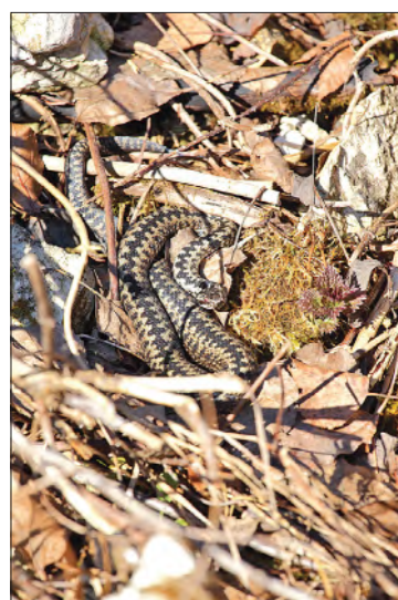
Я проснулась-ш-с-ш.

О! А вот сразу две. Мимо нас, застывших на берегу, не-