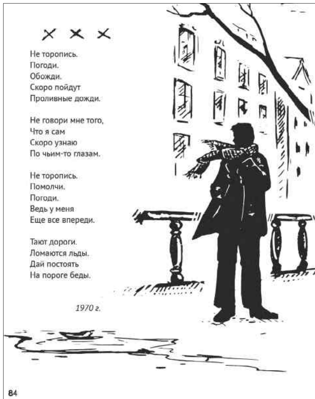
Одна из страниц книги

Владимир Соколов действительно горячо любил Родину, и большую, и малую. У него свой личный патриотизм, неотделимый от тончайших лирических чувств и душевных переживаний. Свое трепетное, бережное, отеческое отношение к родной земле, которой он любит, за которую