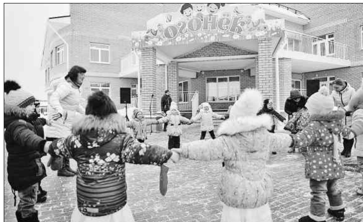
Впервые за много лет в Чуприяновке был построен современный детский сад на 110 мест.

Игорь Руденя помог в решении другой, очень болезненной для жителей Щербининского поселения застарелой проблемы, к тому же связанной с безопасностью. Из-за закрытого железнодорожного переезда, а с пуском «Сапсанов» ситуация