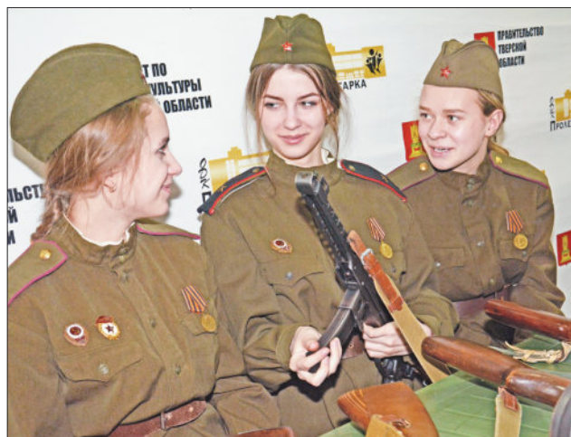
Беспокойные души, горячие сердца и благодарная память о героях.