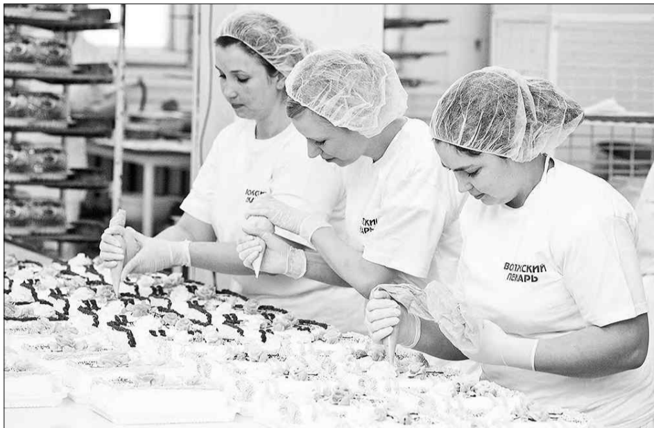
Здесь трудятся специалисты высокого класса.

За счет активной поддержки семьи, материнства, детства в последние годы мы смогли переломить негативные демографические тенденции: добились роста рождаемости и снижения смертности. Однако демографические потери конца прошлого века неминуемо дают о себе знать, поскольку сей-