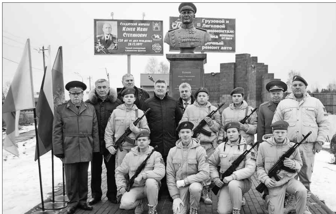
На открытие памятника маршалу Коневу в Поддубках приехали многие почетные гости и юнармейцы Заволжского района.

Действительно, соблюдение грандиозное. Ввод в эксплуатацию