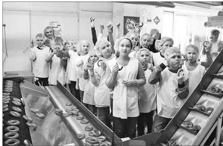
Для кого-то из них это первое знакомство с будущей профессией.

Действительно, почему? Да потому, что людям недостаточно только хорошей зарплаты. Нужны удобный график, хорошие условия труда, наконец, психологический комфорт. И на «Волжском пекаре» все это предусмотрено. При «круглосутке» график работы обсуждают и отлаживают с коллективом. Вме-