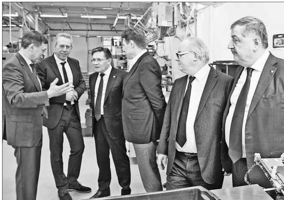
Глава Росатома встретился с представителями бизнес-сообщества Удомли.

Итогом визита в Удомлю делегации отрасли и дивизиона «Электроэнергетический» стал предварительный план совместной намеченной работы администрации Удомельского городского округа, Госкорпорации «Росатом», АО «Концерн Росэнергоатом».