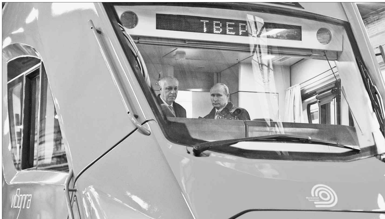
«Иволга» готова тронуться в путь.