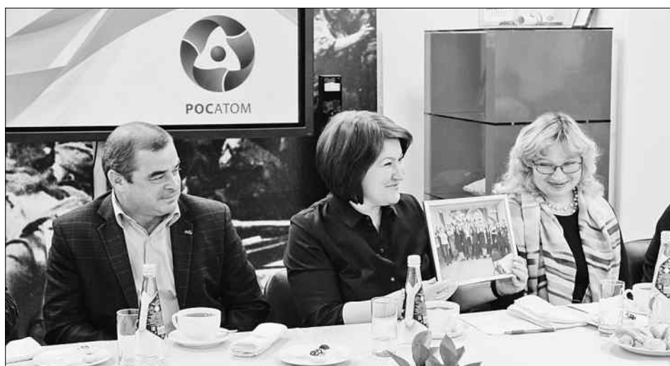
Дружественная атмосфера встречи способствовала доверительному диалогу.