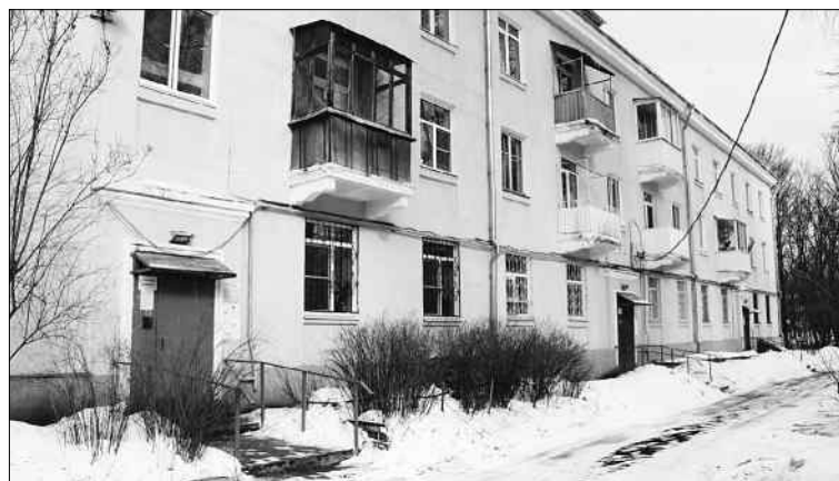
В доме №10, корпус 2 по улице Богданова проведены большие работы.

Но, конечно же, задача номер один – содержание домов. Шесть лет назад, когда компания только появилась, их было всего четыре. Сейчас уже 32, это более 100 тыс. кв. метров. Почти все они расположены в Московском районе.