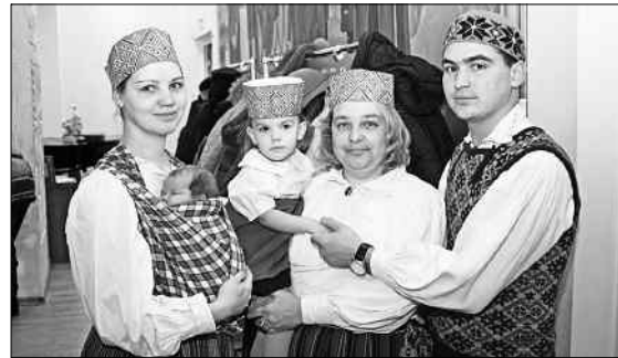
Музыкальный ансамбль «Яблочко».