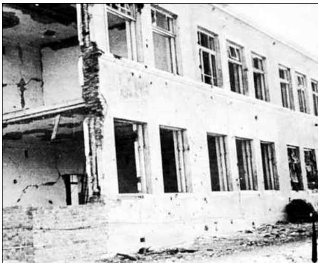
Здание школы в Ржеве, 1943 г.

15 марта 1943 г. «В прифронтовом Ржеве пусто, безлюдно. У развалин средней школы №4 я встретила двух исхудалых ребят Сашу Петрова и Сережу Иванова. Здесь до войны они учились и стали пионерами. Вчера они возвратились в родной Ржев и поселились с родными в землянках по нагорью Волги. С грустью смотрели они на разбитое здание школы... От школы с ними я пошла на Советскую площадь. У разбитого памятника Ленину встретили двух пожилых мужчин, которые снимали веревки с виселицы. Каждый взял одну, бережно завернул в бумагу и убрал в портфель. Третью веревку они передали мне, сказав: «Сохрани для музея! Хотя не скоро, но он в Ржеве будет». Потом они долго расспрашивали Сашу и Сережу о том, кто