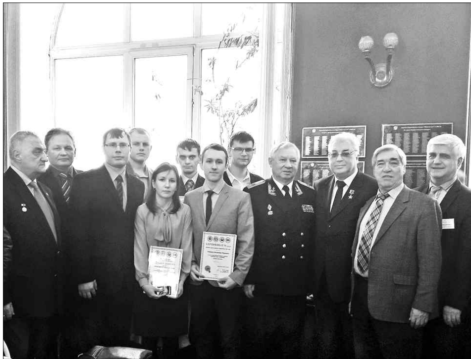
Вот они, лучшие профессионалы страны.