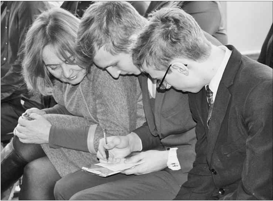
Уже можно составлять план на будущее.