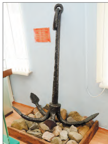
Якорь, найденный на дне Волги.

ляна колонна, ушла под лед. Сотрудники отряда спасателей обнаружили и подняли наверх грузовик. Известно, что на дне озера лежит еще техника. В министерстве решается вопрос о финансировании экспедиции и продолжении поисков.