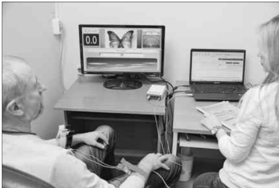
Проведение сеанса тренинга.