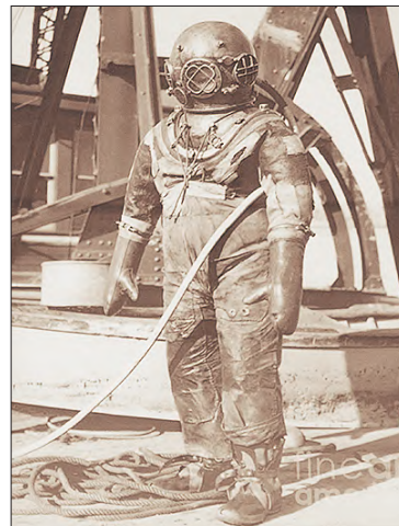
К погружению готов.

— Мы имеем дело с несчастными случаями, наша деятельность — тяжелый нудный труд. Мы надеемся наладить сотрудничество с портом, предприятиями, имеющими водозаборные системы, которые требуют ремонта. А как хорошо мы сотрудничали с Музеем Калининского фронта! Меня приглашали поработать в Новгород, где затонул военный самолет, в Волгоград. Вот это интересно!