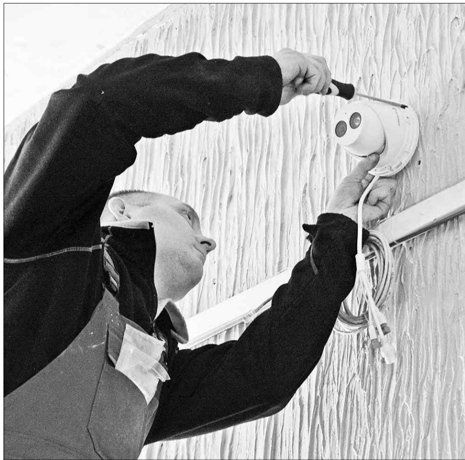
Идет монтаж видеокамер.