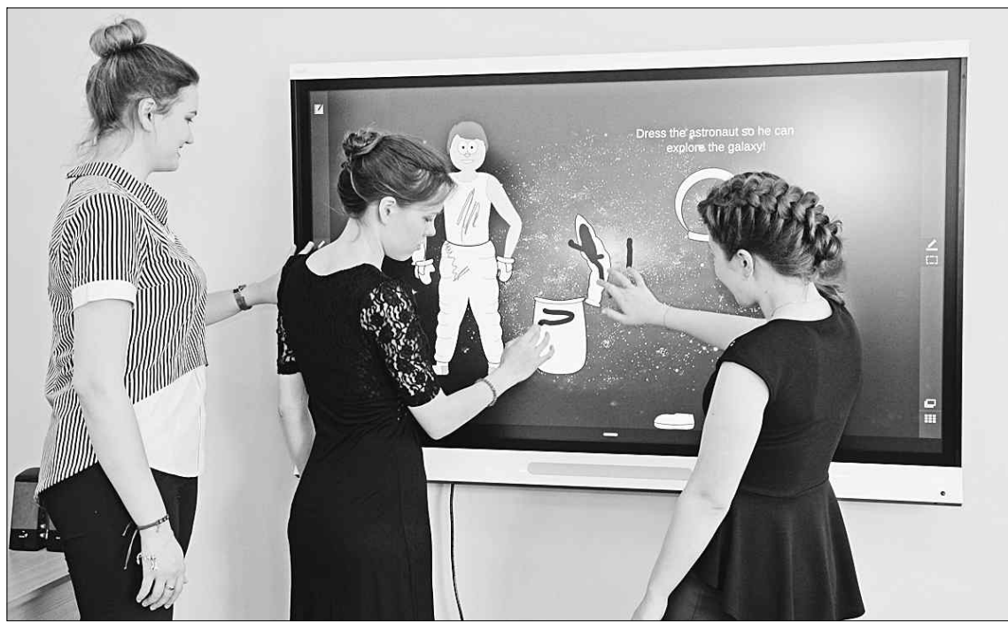
С помощью smart-панели можно подобрать космонавту скафандр на любой вкус.

В прошлом году колледж получил от области грант в размере 1 млн рублей и приобрел помимо планетария интерактивные кубы, smart-панель, образовательную систему EduQuest, конструктор Lego для занятий робототехникой. Пожалуй, единственный нецифровой