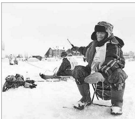
У лунки.

кормки и крючки, лески и удочки – у каждого свои секреты, которыми во время соревнований никто, конечно, друг с другом не делился.