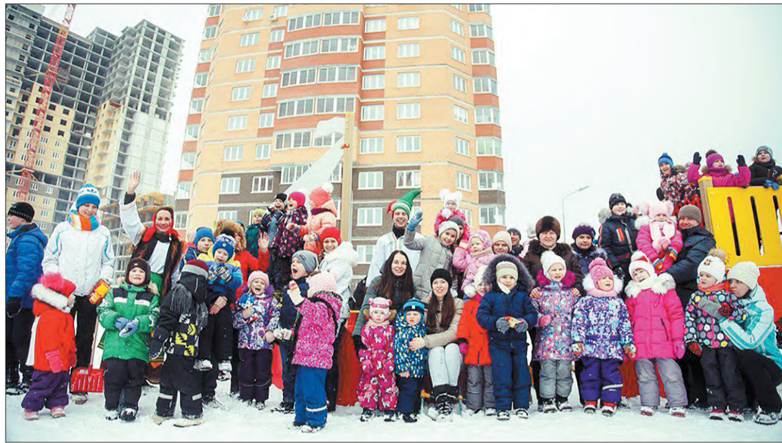
На празднике гуляли и дети, и взрослые.

Благоустраивают территорию здесь всем микрорайоном. И праздники встречают так же. Изящные сакуры — это по-настоящему красиво и стильно, но нам, русским людям, все-таки ближе другая картина, без которой конец зимы в России не представить. Горячие блины, народные запевки, столб с подарками наверху, веселые скоморохи с шутками-прибаутками на все случаи жизни, горящее ярким пламенем чучело Масленицы... 18 февраля — послед-