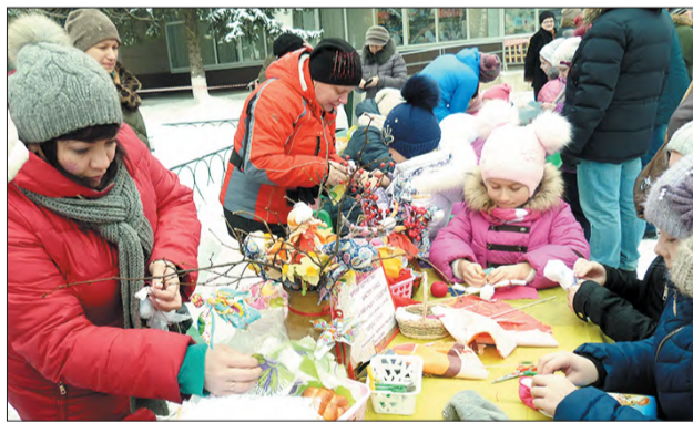
Мастер-класс по изготовлению обрядовой куклы-масленички.