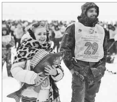
Не только рыбу поймали, но и отдохнули.