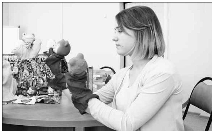
Единственный нецифровой элемент «Цифрового детского сада» — традиционный кукольный театр.

Многие дети уже в дошкольном возрасте пользуются разными гаджетами. Поэтому воспитатель должен говорить с ними на современном языке.