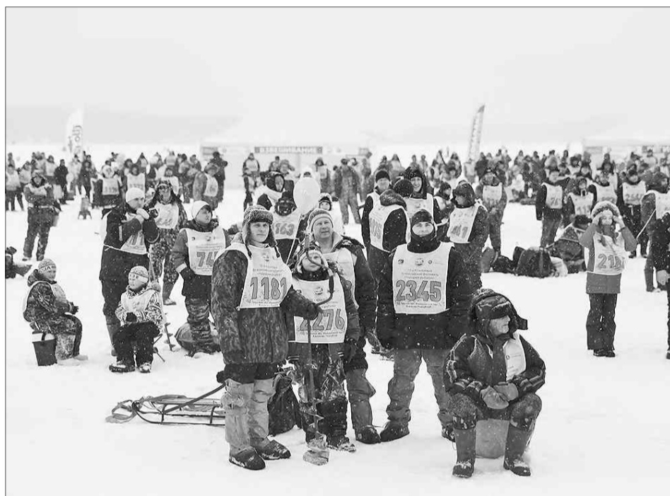
В ожидании начала рыбалки.

Погода участников не разочаровала: легкий морозец, безветренно, даже солнце выглянуло пару раз. Идеальные условия. Под громкий сигнал ракеты рыбаки – кто с семьями, кто в одиночку – стали искать самое удачное, по их мнению, место, где точно будет клев. В ход пошли различные при-