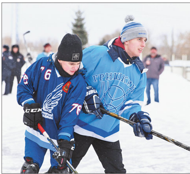
Борьба была эмоциональной и динамичной.

Создание условий для развития массовых видов спорта, семейного досуга, привлечения населения к здоровому образу жизни