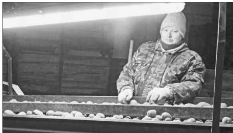
Несмотря на дождливое лето, урожай удалось сохранить.