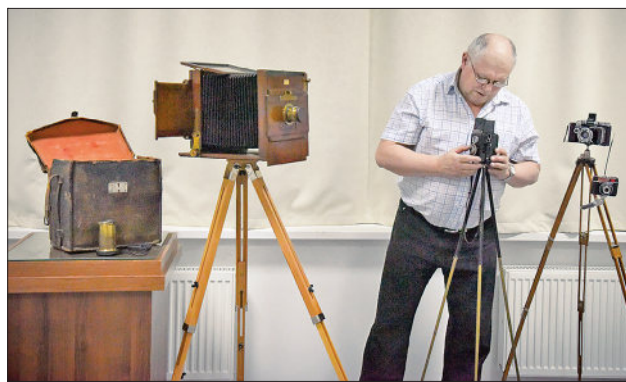
Мастер за работой.