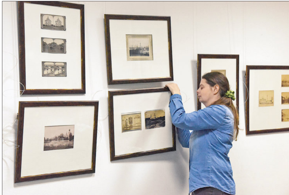
При подготовке экспозиции.