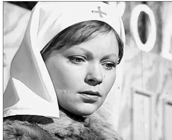
Кадр из фильма «Доктор Вера».

12 января мы отмечаем 315 лет с начала строительства Вышневолоцкой водной системы. Идея ее создания принадлежит императору Петру Первому. Именно он указом от 12 января 1703 года предписал «соединить перекопью реки Тверцу и Цну». Так был построен водный путь, который соединил Петербург с остальной Россией. Огромная роль в сооружении этой водной системы принадлежит Михаилу Ивановичу Сердюкову, памятник которому сегодня украшает Вышний Волочек.