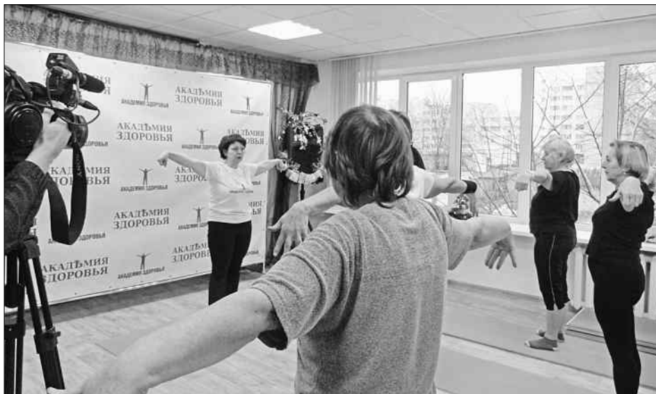
Всем участникам проекта занятия добавили уверенности и интереса к жизни.