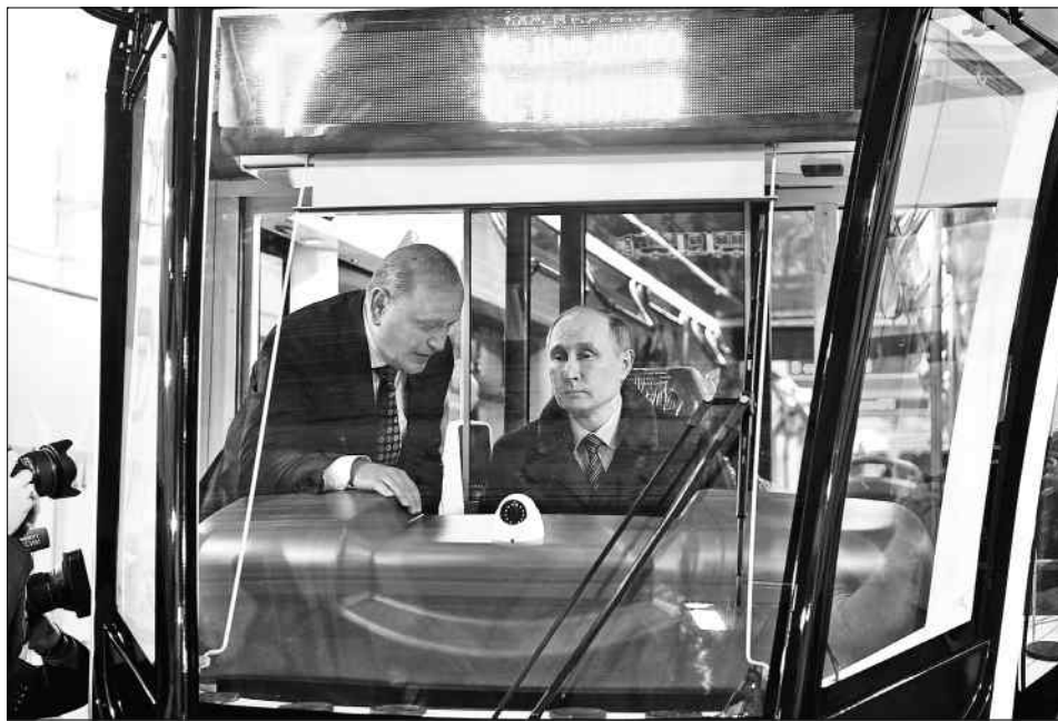
На 17-м маршруте.