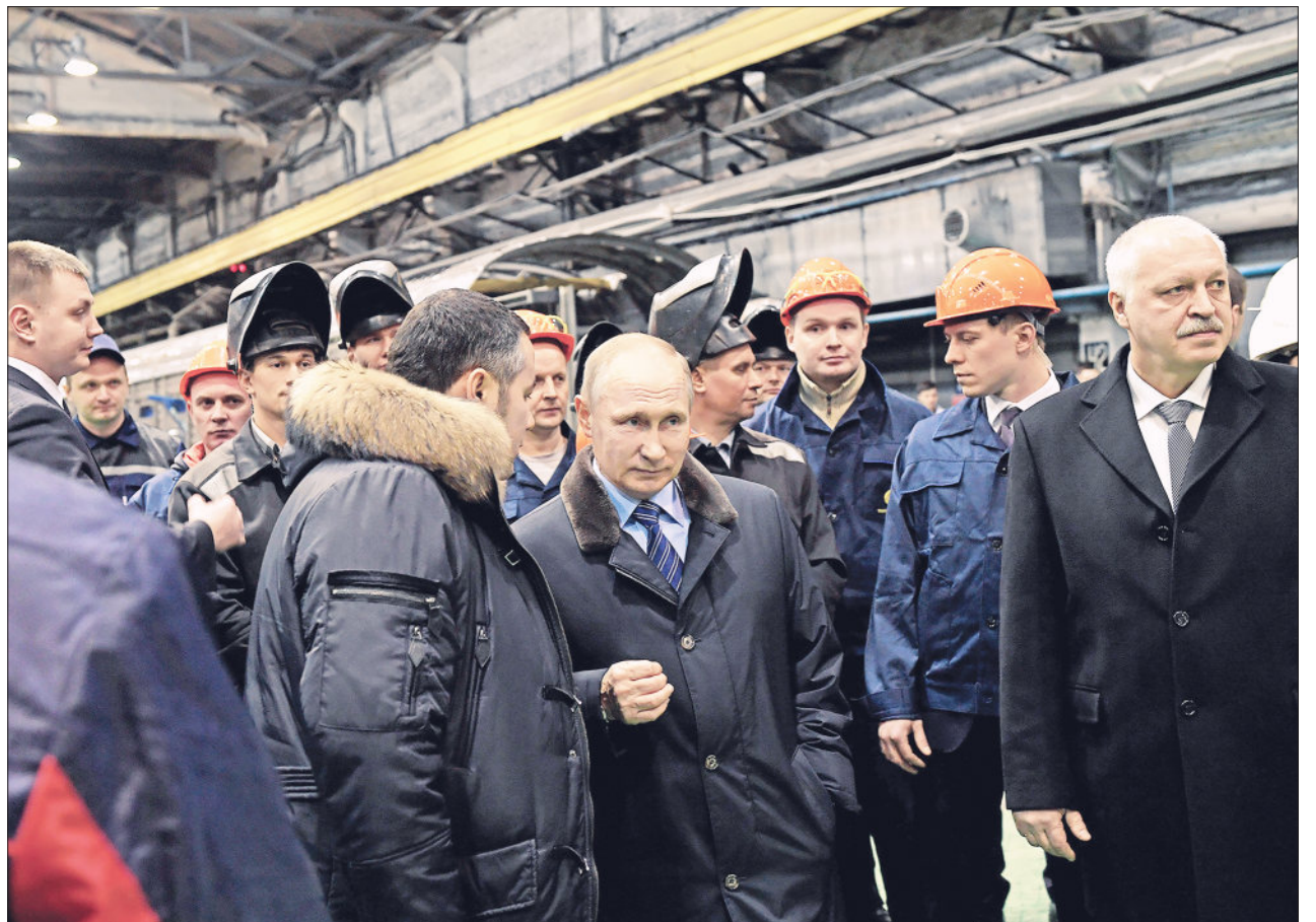
На ТВЗ Президент России пообщался с рабочими и ознакомился с новинками завода.