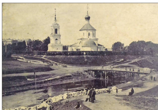
Неизвестный фотограф. Церковь Николая на Зверинце в г. Твери. 1898 год. ФОТО: ТОКГ

В собрании картинной галереи находится ряд интересных фотографий, принадлежащих известным мастерам светописа, которые запечатлели жизнь Тверской губернии второй половины XIX – начала XX веков. Облик наших городов, лица людей, сама атмосфера того времени оказались сохранены на этих отпечатках. Самый ранний из них – портрет писателя Ивана Лажечникова, сделанный Карлом Даутендеем в начале 1850-х годов в Санкт-Петербурге. Имя русского Вальтера Скотта, как называли Лажечникова современники, напомним, тесно связано с Тверью: автор романов «Последний новик» и «Ледяной дом» был директором мужской гимназии, служил тверским вице-губернатором, владел имением Конопкино в Старицком уезде, где проводил летние месяцы. Именно здесь Лажечников завершил роман «Басурман». Карл Даутендей был саксонским подданным. Он одним из первых открыл дагерротипную мастерскую в Санкт-Петербурге, в кон-