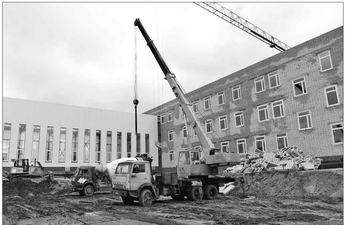
Строим новые дома.

На совещании с членами регионального правительства также шла речь об электроснабжении районов области. Празд-