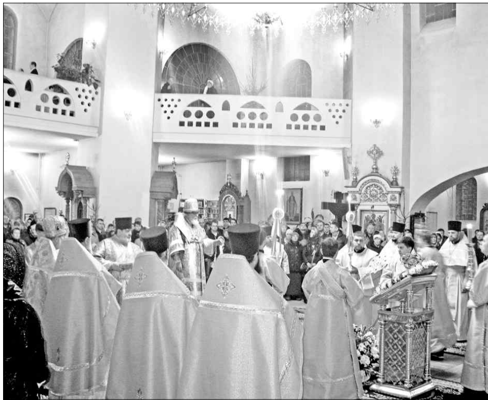
Богослужение в кафедральном Воскресенском соборе.