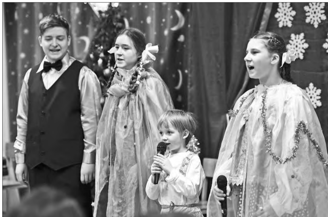
На спектакле добро победило зло.

Сейчас Ксюша учится в седьмом классе, но в родной школе уже стала опытной актрисой. Девочка успела исполнить роль